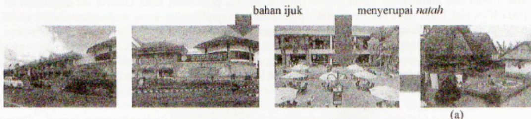
Gambar 9 Mal Bali Galeria - Simpang Siur Kuta. Sumber (a) Wijaya, 2002: hal.81

Kompleks pertokoan di Kuta ini berdiri sekitar tahun 1995, Terdiri dari tiga bangunan yaitu Duty Free Shop, bioskop Galeria 21 dan malnya itu sendiri. Sebagai pemilik dan pengelola, PT Inti Dufree Promosindo Jakarta, berupaya tetap menghadirkan nuansa arsitektur Bali pada bangunan berlantai dua ini. Dalam hal bahan, mal ini lebih banyak menggunakan bahan lokal seperti bata, paras, genteng hingga ijuk bagi penutup atapnya. Namun juga tidak tertutup terhadap penggunaan bahan hasil olahan teknologi modern, yaitu adanya penggunaan kaca terutama pada daerah etalase. Dalam hal tata ruang, mal ini memiliki ruang terbuka di bagian tengahnya, sehingga sebut saja ruang ini menyerupai natah . Dalam hal proporsi, bangunan ini juga memenuhi tatanan Tri Angga yang memiliki tiga bagian tubuh yakni kepala (atap), badan (dinding) dan kaki ( bebaturan ). Bangunan retail ini masih menggunakan warna-warna asli dari bahan-bahan lokalnya. Teknologi yang digunakan dalam bangunan ini jelas menggunakan teknologi modern untuk bangunan berlantai dua dengan bentang yang sangat lebar.