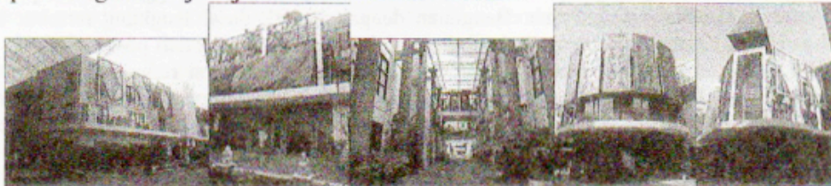
Gambar 2. Pada bangunan (1) yang menggunakan bentuk kolom Yunani, bangunan (2) dan (4) yang menampilkan ukiran Bali, bangunan (3) berupaya menampilkan ornamen-ornamen khas Bali, bangunan (5) menampilkan atap berbentuk meru

Sedangkan di Bali, walaupun sudah memiliki Peraturan Daerah Provinsi Bali no.5 tahun 2005 salah satunya disebutkan tentang wajah bangunan di Bali yang diharuskan bernafaskan pakem-pakem Arsitektur Tradisional Bali, namun dalam pelaksanaannya di lapangan terutama pada bangunan-bangunan retail, unsur lokal hanya dijadikan sekedar tempelan saja, tanpa memahami falsafah dan karakter yang terkandung dalam detail-detail tersebut. Hal ini bisa dilihat pada contoh kasus yang diangkat pada penelitian ini yaitu bangunan-bangunan retail di kompleks pertokoan Kuta Galeria. Pada kompleks bangunan retail ini banyak terdapat jenis bangunan hybrid yang unsur-unsur lokal Bali hanya sekedar menjadi tempelan (terutama pada pemanfaatan ornamen-ornamen arsitektur tradisional Bali). Beda halnya dengan desain hybrid pada bangunan tempat tinggal, sebagian besar penerapan konsep desain hybrid pada bangunan retail tidak berhasil dengan baik. Padahal sebagai bangunan retail yang merupakan public space , justru bisa menjadi media promosi tetap memperkenalkan bentuk arsitektur lokal Bali di dalam upayanya untuk selalu beradaptasi dengan kemajuan jaman melalui desain modern.