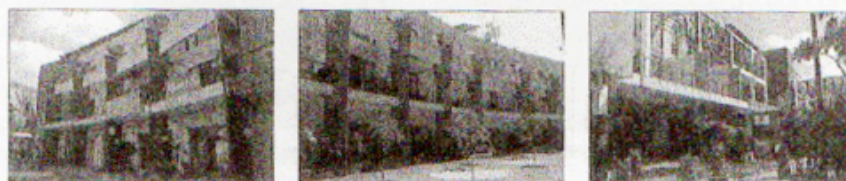
Gambar 6 Sesuai pengertiannya maka area promenade didominasi keberadaan pedestrian way

Arti kata promenade itu sendiri adalah tempat untuk berjalan-jalan. Istilah ini memiliki pengertian yang sama dengan esplanade (istilah dari Spanyol). Area ini biasanya merupakan area pedestrian yang cukup lebar dan berada di tepi perairan seperti sungai, danau atau laut, namun bisa juga berada di tengah perkotaan. Aktivitas yang diwadahi tidak melulu berjalan kaki namun kini lebih bervariasi seperti duduk-duduk, berekreasi, membeli dan menikmati es krim dan sebagainya. Pada kompleks pertokoan ini, tema promenade diaplikasikan pada beberapa blok bangunan bagian tengah. Sesuai pengertiannya, maka pada area ini kendaraan tidak bisa masuk dengan cara meninggikan level pedestriannya beberapa centimeter jauh lebih tinggi daripada jalan utamanya, dan juga menggunakan bahan yang berbeda yaitu paving. Sehingga, pengunjung pertokoan pada area ini harus memarkir kendaraannya terlebih dahulu di sisi selatan kompleks pertokoan dan kemudian berjalan kaki. Namun promenade di kompleks pertokoan ini tidak dijumpai adanya fasilitas untuk duduk-duduk ataupun kegiatan rekreasi lainnya. Sehingga promenade di sini hanya digunakan sebagai area berjalan kaki saja menuju tenant atau toko. Fasade bangunan tidak jauh berbeda dengan dua tema sebelumnya, masih berupaya menampilkan bentuk arsitektur hybrid , namun keberadaan antara arsitektur lokal dan modernnya masih terpisah. Arsitektur modern masih mendominasi, sedangkan arsitektur lokal dalam hal ini arsitektur Bali masih dijadikan tempelan.