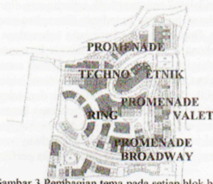
Gambar 3 Pembagian tema pada setiap blok bangunan

jika tenant ingin melakukan perubahan fasade pada bangunan yang disewa atau dibelinya, masih diperbolehkan sepanjang masih mengikuti tema yang sudah diatur pembagiannya per blok bangunan.