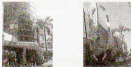
Gambar 7 Penerapan tema techno dengan memanfaatkan bahan-bahan hasil teknologi

Kata techno merupakan istilah singkat atau populer dari kata teknologi yang merupakan pengetahuan terhadap penggunaan alat dan kerajinan, dan bagaimana hal tersebut mempengaruhi kemampuan untuk mengontrol dan beradaptasi dengan lingkungan alamnya. Pengertian teknologi yang tertua, sangat sederhana dan paling umum dikenal orang lain adalah sebagai barang buatan manusia untuk membantu mempermudah kehidupannya. Maka teknologi memiliki tiga ragam dasar yang sekaligus menunjukkan perkembangan historis yang berlainan. Ragam dasar tersebut adalah alat, mesin dan automaton. Tema techno pada kompleks pertokoan Kuta Galeria ini diaplikasikan pada blok sisi barat daya dari kompleks pertokoan. Pengaplikasian tema techno itu sendiri lebih terlihat pada pemanfaatan bahan-bahan hasil teknologi itu sendiri seperti kaca yang dimanfaatkan sebagai dinding penerima beban atap. Selain itu, terdapat bentuk-bentuk lengkung yang pembuatannya juga memerlukan teknologi yang tidak biasa. Bentuk arsitektur lokal Bali hanya terlihat pada ragam hiasnya, sehingga keberadaan konsep hybrid tidak berhasil.