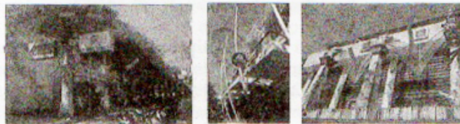
Gambar 5 Penerapan tema broadway pada area entrance pertokoan

Pada kompleks pertokoan ini tema broadway diterapkan pada blok bangunan di sisi timur dan barat dari main entrance . Dapat dijumpai kesamaan keberadaan signage yang mendominasi di sepanjang jalan masuk Pertokoan Kuta Galeria ini menuju ke central parking yang berada di sisi selatan kompleks. Signage sebagian besar berupa petunjuk arah menuju masing-masing tenant atau toko yang dimaksud. Sedangkan untuk fasade bangunan, sama seperti fasade bangunan-bangunan yang bertema valet , juga lebih didominasi dengan gaya dan teknologi arsitektur modern yang menenggelamkan gaya arsitektur lokalnya. Terdapat beberapa bentuk analogi pada area ini seperti payung besar yang lebih menyerupai jamur, bentuk bunga hingga patung setengah badan yang menyerupai patung oscar (hal ini terkait dengan tema broadway yang berujung kepada pemberian penghargaan oscar sebagai penghargaan tertinggi dalam dunia perfilman Amerika).