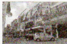
Gambar 4 Penentuan tema valet yang dilatarbelakangi adanya fungsi parkir