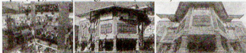
Gambar 10 Ramayana Mal Bali - Denpasar

Kompleks pertokoan di jalan Diponegoro, Denpasar ini terdiri dari tiga lantai. Sama halnya dengan Mal Bali Galeria, bangunan ini juga menghadirkan nuansa arsitektur Bali. Dalam hal bahan, mal ini banyak menggunakan bahan lokal seperti bata, paras hingga genteng bagi penutup atapnya. Dalam hal tata ruang, mal ini memiliki ruang semi terbuka di bagian tengah yang berupa void. Dalam hal proporsi, bangunan ini juga memenuhi tatanan Tri Angga yang memiliki tiga bagian tubuh yakni kepala (atap), badan (dinding) dan kaki ( bebaturan ).