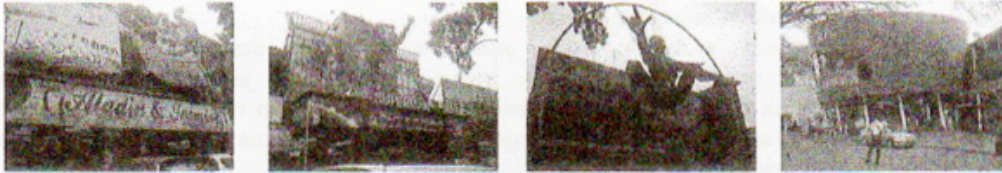
Gambar 1 Penerapan tema analogi di daerah Cihampelas

kompleks pertokoan tersebut yang menggunakan bentuk ember yang sering digunakan KFC untuk mewadahi pembelian ayam goreng dalam jumlah yang banyak.