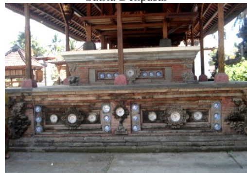
Gambar 7. Penggunaan piring keramik pada salah satu bangunan kuno disebut bangunan Bale Pegat di Pura Payogon Agung di Desa Ketewel Gianyar