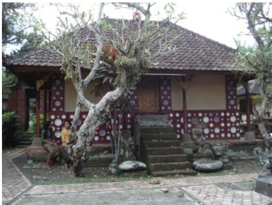
Gambar 4. Penggunaan piring keramik pada bangunan kuno Bale Saren Teguh di Puri Agung Kerambitan Tabanan

Pembahasan selanjutnya adalah kajian nilai-nilai estetik penggunaan piring keramik porselin sebagai ornamen bangunan bekas kerajaan di Bali. Penggunaan piring keramik tersebut dapat dilihat pada bangunan seperti gambar di bawah ini.