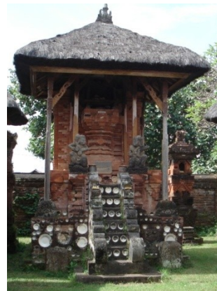
Gambar 5. Penggunaan piring keramik pada bangunan kuno Pelinggih Bhatara Brahma di Puri Satria Denpasar