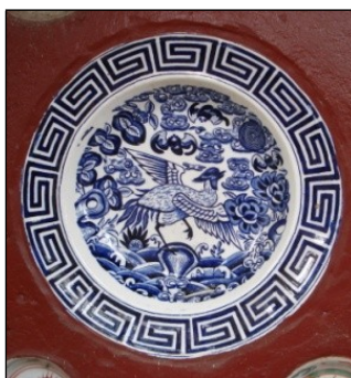
Gambar 1. Piring motif burung merak, garis tengah (gt): 24cm.

Faktor lain yang juga juga menjadi landasan penilaian estetis pada kajian ini adalah keteraturan unsur rupa, kerapian dalam wujud yang menunjukkan kualitas pengerjaannya. Keteraturan dan keseimbangan dapat ditunjukkan melalui unsur bentuk, warna dan jarak, sedangkan tingkat kerumitan dan kerapian berkaitan dengan teknis ditentukan oleh tingkat keahlian tangan ( craftsmanship ) pembuatnya. Berikut kajian nilai-nilai estetis ornamen piring keramik poselin pada bangunan-bangunan kerajaan di Bali.