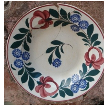
Gambar 3: Piring motif lukisan bunga, gt: 23cm.