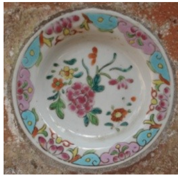
Gambar 2. Piring motif bunga ping, putih dan kuning, gt: 22,5cm.