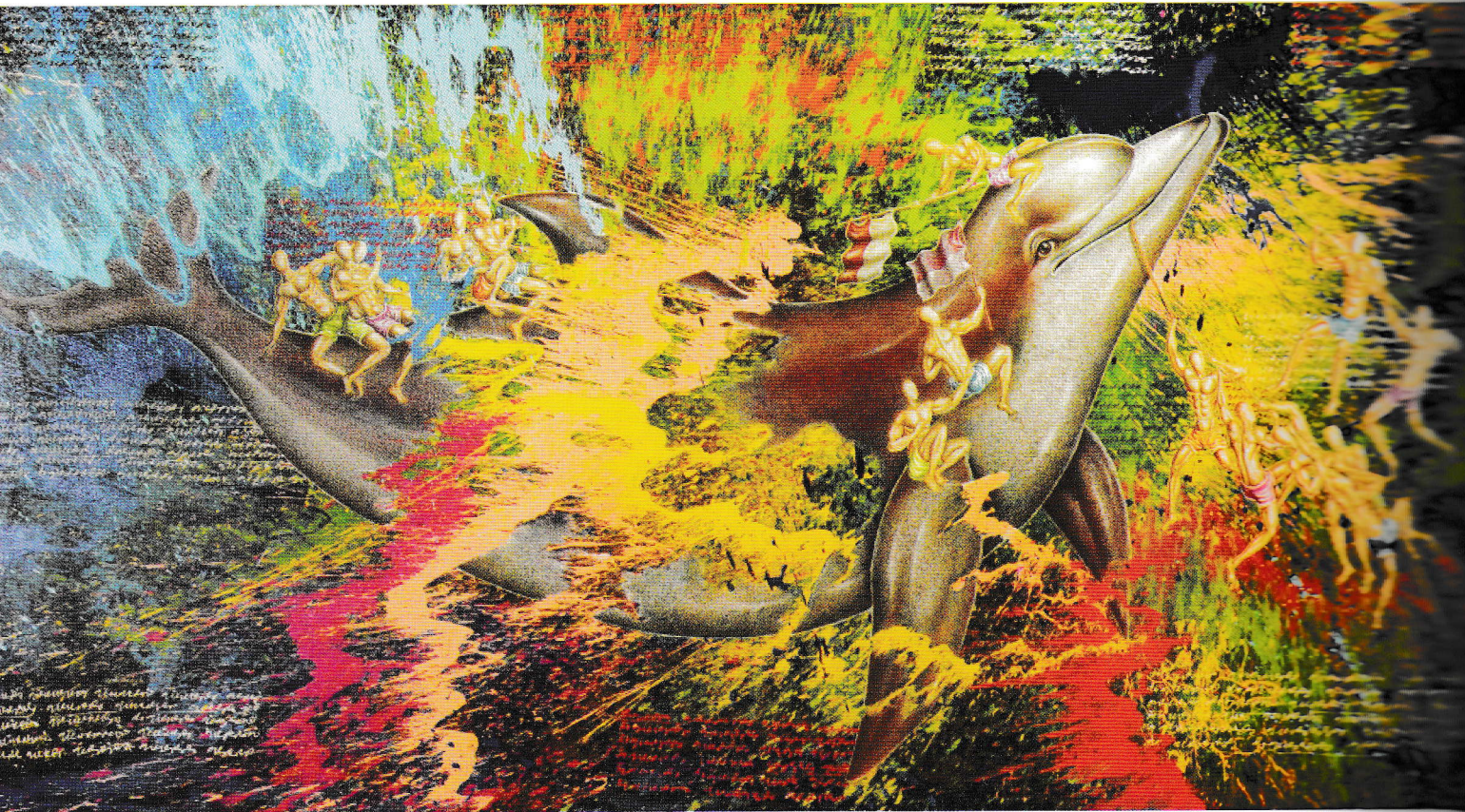
A Hero from the Sea

160 x 300 cm | Tinta dan akrilik pada kanvas | 2016