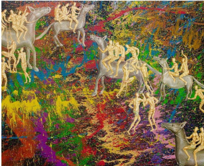
Figure 2, karya berjudul 'Cavalry Force', 160X200 Cm, ink & acrylic on canvas, 2017.

Eksplorasi bahasa visual berhubungan dengan temuan pendekatan penciptaan subject matter visual. Berdasar hasil analisis penelitian ini menemukan konsep kepahlawanan dunia sehari-hari dari orang-orang biasa berbaur dengan kehidupan istana sebagai tema utama. Tema tersebut diurai dalam visual karya dengan temuan lima pendekatan/metode penciptaan seni lukis kontemporer, yaitu: (a) cutting (menggunting; membayangkan relief Yeh Pulu seperti layaknya lembar poster komik, yang kemudian dapat digunting bebas); (b) coloring (memberi warna sesuai kemauan artistik pelukis); (c) highlighting (menjadikan subjek/adean/plot relief tertentu sebagai pusat perhatian); (d) smashing (merangkai pecahan dan kepingan relief yang berserak akibat korusi bebatuan); (e) drawing (konstruksi subjek visual berbasis gambar/teknik garis).