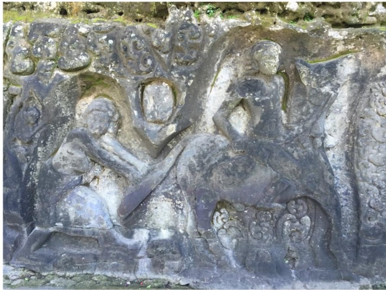
Figur 1, salah satu fragmen relief Yeh Pulu, seorang pangeran hendak memacu kudanya, namun terhalangi oleh ekor kuda yang seperti tiba-tiba ditarik seorang putri.

kudanya untuk lari”. Pernyataan ini memberi kesan, sedemikian detail penggambaran relief, sampai secara sengaja menanggalkan pelukisan pelana, demi memperlihatkan drama seorang pangeran yang hendak lari dengan memacu kudanya, jelas menunjukkan penggambaran yang realistik. Kemudian kalau diselidik dari visual karya jelas terlihat penggambaran figurasi subjek relief bahkan mendekati proporsi manusia normal, bahkan sedikit jangkung itu tentu sangat ideal untuk menggambarkan adegan kepahlawanan penunggang kuda.