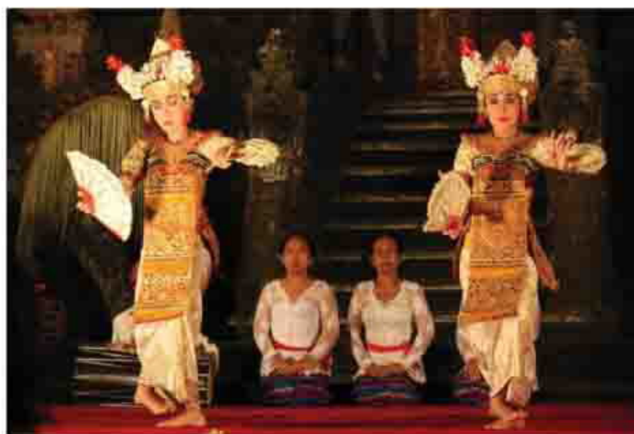
Gambar 2. Bagian Inti Pertunjukan Tari SangHyang Dedari di Puri Saren Agung Ubud