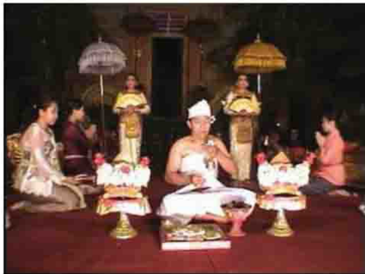
Gambar 1. Bagian Awal Pertunjukan Tari SangHyang Dedari di Puri Saren Agung Ubud

Pada bagian pinggang dililitkan sabuk prada berwarna kuning dengan motif bun-bunan untuk menutupi badan hingga di atas pinggul. Pada bagian dada penari digunakan lamak dari kulit sapi, pada bahu dipasang simping dari kulit sapi. Sementara pada bagian dada dililitkan tutup dada dari kain beludru yang dihiasi sulaman dan manik-manik. Sementara pada pergelangan tangan dipasang gelang kana dari kulit sapi yang dilapisi prada emas, dan pada leher penari dipasang badong dari kulit sapi yang dilapisi prada emas. Sebagaimana tampak pada gambar di bawah ini.