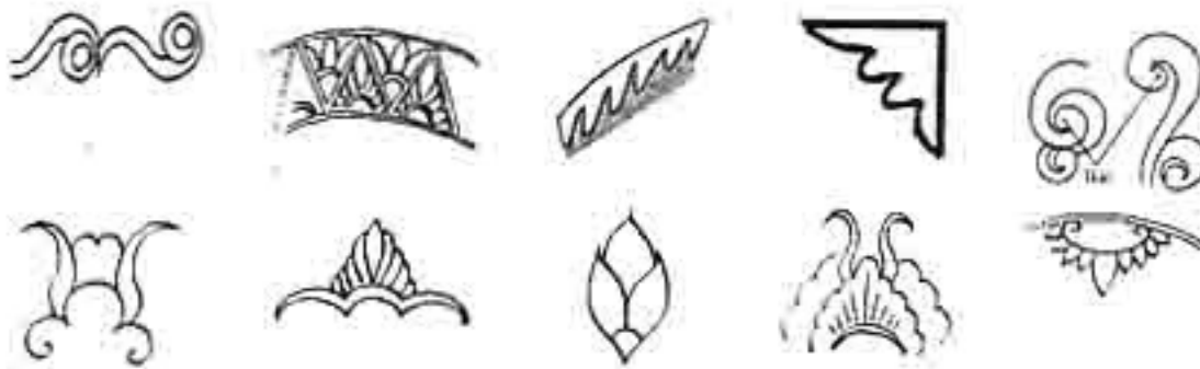
Gambar 2. Motif ornamen hias topeng Malang