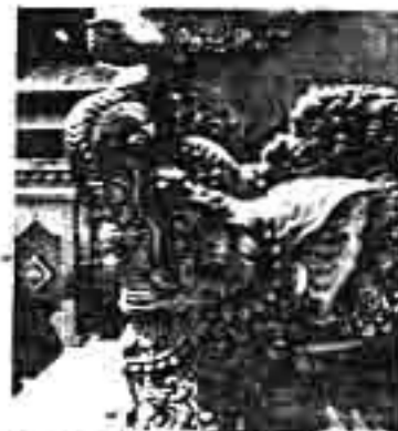
Gambar 4. Karang hanti dengan belalai diangkat