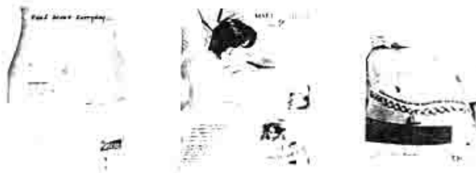
Gambar 5. Berbagai contoh perempuan sebagai objek tunda dalam iklan dalam berbagai produk.