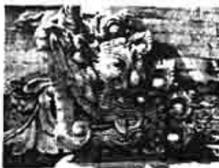
Gambar 3. Karang hanti tanpa daun telinga (sumber: survey, 2009)