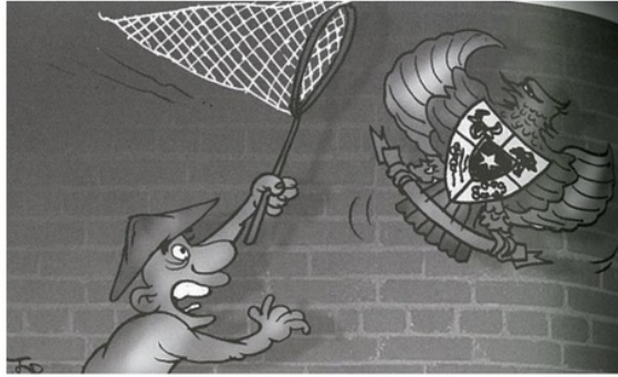
Gambar 1. Menangkap Garuda Pancasila

Nilai yang termaktub dalam sila Pancasila, merupakan intisari dari seluruh karakter bangsa. Masyarakat Bali yang kian terbuka dengan ide baru, dapat menjadi pemicu memudarnya nilai moral. Oleh karena itu, gambar tersebut merupakan parodi dengan pesan yang dalam menggugah publik mempertahankan Pancasila sebagai sumber kehidupan berbangsa.