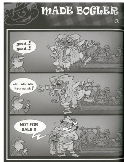
Gambar 3. Not For Sale

Gambar 3 adalah merupakan parodi tentang warisan budaya sudah terjual, yang menampilkan tokoh dalam kartun ini yaitu Made Bogler dalam gambar yang tersusun dengan tiga frame . Pada gambar tersebut, terlihat tokoh Made Bogler sedang menari Barong sebagai sebuah tarian yang dianggap sakral. Latar belakang gambar adalah penabuh dan gamelan, juga terlihat seorang penonton atau turis asing yang memuji-muji penampilan Made Bogler seperti yang dituliskan dalam balon kata. Setelah memuji, sang turis kemudian menawar untuk membeli. Pada frame terakhir Made Bogler menolak tawaran dengan kata-kata “Not for sale” dalam balon kata.