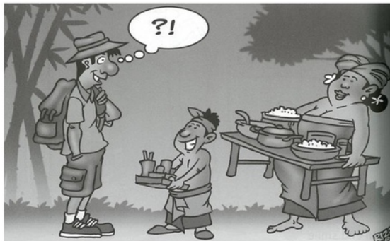
Gambar 4. Ramah Tamah Orang Desa

Bangsa Indonesia, dikenal sebagai bangsa yang ramah, sehingga menjadikan orang asing (Barat) menyukai bangsa ini (IDN Times, 2016). Hanya saja, akhir-akhir ini wajah ramah bangsa ini digantikan dengan wajah yang sinis, dingin, penuh amarah dan curiga. Pada gambar 4, ada seorang pelancong asing yang bertanya-tanya dengan sambutan masyarakat terhadapnya. Seorang wanita, membawakan makanan diatas sebuah meja kecil dan seorang anak laki-laki menyuguhkan minuman ( refreshment ).