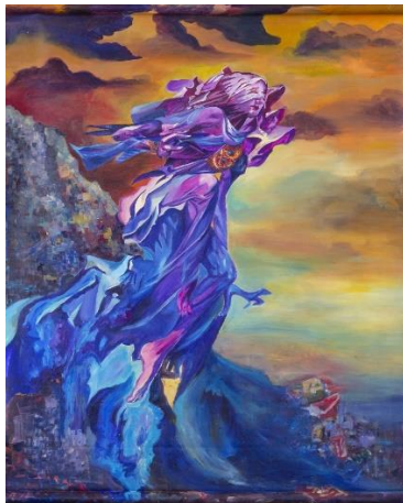
Ni Wayan Penawati “Senja”, Akrilik di atas linen, 150 x 180 cm tahun 2018.

sampah khususnya yang berbahan plastik sebab salah satu sampah yang susah diuraikan. Terpilihnya judul “Senja” sebagai kata yang memaknai tertutupnya sisi ibu pertiwi dalam gelap, pada filosofi umat hindu di Bali juga memaknai senja tersebut sebagai waktu untuk bhuta kala keluar. Bhuta kala adalah simbol waktu untuk makhluk yang dibawah derajat manusia keluar. Pada waktu ini dipercayai sebagai waktu yang gelap, kotor, tidak baik, sehingga sama dengan pikiran penulis diibaratkan dengan sampah yang menggunung, hingga saat ini yang menjadi masalah lingkungan. Kondisi tersebut diterapkan pada objek figur perempuan yang dihadirkan sebagai sifat kuat dan tangguh.