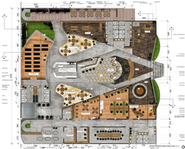
Gambar 1: Denah Penataan Fasilitas Lt.1