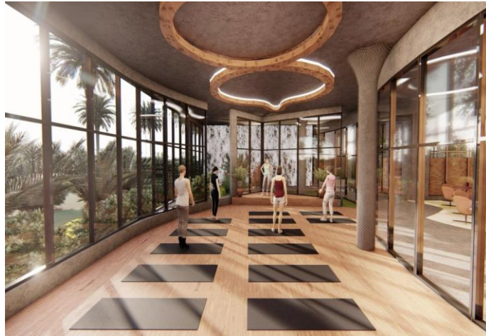
Gambar 3: Contoh Visualisasi Satya Shala Hall