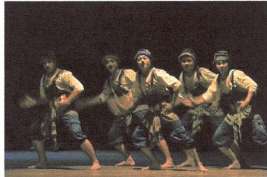
Gambar 4, Sangging 1

Tripod berfungsi untuk meminimalisir goyangan kamera oleh tangan pemotret, sehingga lebih menjamin latar belakang dan objek lain yang diam atau relatif bergerak pelan dapat tertangkap tajam.