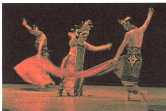
Gambar 2, Mabuung 2

Penggunaan Slowspeed dalam merekam pementasan tari Mabuang Karya Merthajaya, tari ini terinspirasi dari pergaulan anak muda desa Tenganan. Ciri dari tarian ini menggunakan kain khas tenun Pegringsingan. Gerakan penari yang terekam secara visuality blurred melalui pemotretan kamera bergerak dengan speed 1/40 detik dengan aperture 2,8 dan ISO 640 untuk menonjolkan impresi gerakan yang perlahan, dinamis dan indah. Karakteristik gerakan penari yang dominan pada gerakan tangan dan jari jemari, dipotret menggunakan format medium close-up untuk menghasilkan efek blur yang ritmis akibat tertariknya cahaya yang menerpa jari-jari tangan pemain dan gerakan pada kain penari. Selain itu pemotretan format medium close-up juga membidik ekspresi penari yang masih tampak tajam pada bagian outline atau profil wajah.