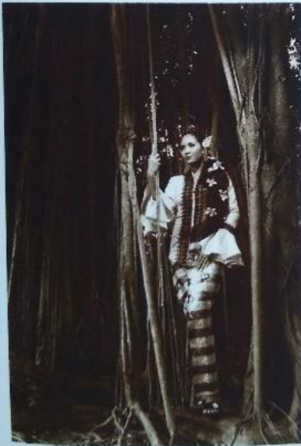
Cok Nindhia Mystical Beauty Foto Di Atas Adhesive 70 x 50 cm 2017