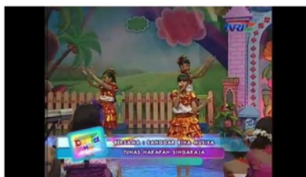
Gambar 4 :Tata Artistik Dunia Anak TVRI Bali

menggembirakan, menggairahkan dan merangsang (Birren, 1996) Pada pembahasan ini warna hangat disini digunakan sebagai situasi yang menggembirakan, dikarena sebagian besar kegiatan dari program ini adalah menghibur dan tentunya menyenangkan bagi anak-anak sebagai pengisi acara.