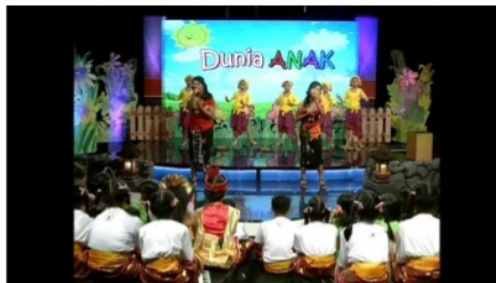
Gambar 1: Segment 1 Menit 2:46 Program Dunia Anak TVRI Bali

Anak diaplikasikan warna biru yang cenderung lebih banyak, dapat dilihat pula properti tambahan seperti pagar buatan, bunga buatan juga diletakkan diantara panggung.