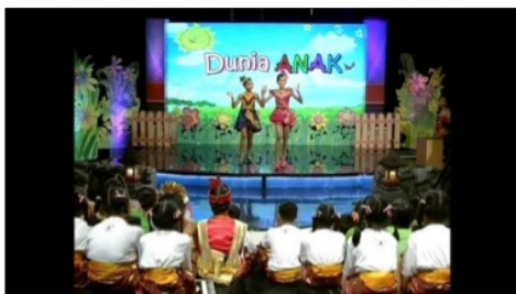
Gambar 2: Segmen 1 Program Dunia Anak TVRI Bali Sumber: LPP TVRI Bali, Tahun 2018

Video yang menjadi acuan untuk dianalisis warna pada tata artistiknya adalah video program Dunia Anak yang tayang pada tahun 2018 dengan tema Bhineka Tunggal Ika yang mana pengisi acara program tersebut berasal dari SD Negeri 1 Kawan Bangli.