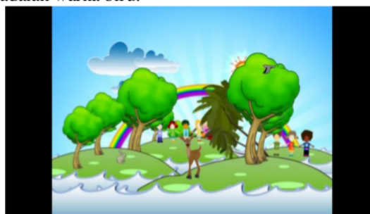
Gambar 6 : Bumper Program Dunia Anak TVRI Bali

Warna biru merupakan salah satu golongan dari warna dingin, biru dikatakan sebagai warna yang idealis, konservatif, dan predictable . Warna ini merupakan warna yang cocok dipadupadankan dengan warna yang lainnya. Warna biru banyak memberikan kesan keyakinan, kepercayaan, dingin, depresi dan duka berkepanjangan, warna biru banyak ditemui di alam semesta. Warna biru dilambangkan sebagai alam seperti langit dan laut yang memberikan ketenangan, kebebasan dan kehidupan. Warna biru diaplikasikan sebagai warna langit yang cerah, sehingga dapat memberikan kesan tenang, dan kehidupan (Luzar, 2011). Warna biru ini diaplikasikan dominan pada bumper program Dunia Anak TVRI Bali yang mana warna biru ini mewakili gambar langit yang notabene adalah warna biru.