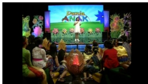
Gambar 3 :Segmen 1 Dunia Anak SD Cipta Dharma

Selanjutnya akan diberikan contoh dari pengisi cara SD Cipta Dharma Denpasar, yang mana temayang akan ditampilkan tentu saja berbeda dari SD sebelumnya,