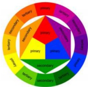
Lingkaran Warna.

8 Warna-warna tersier diantaranya adalah coklat kunir, coklat merah, dan coklat biru. Pembahasan warna jenis-jenis warna berdasarkan teori tiga warna primer, tiga warna sekunder, dan enam warna intermediate . Kedua belas warna ini kemudian disusun dalam satu lingkaran warna yang biasa disebut dengan the color wheel .