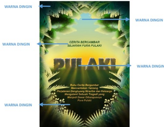
Poster Cerita Bergambar Sejarah Pura Pulaki

dan teks (judul & teks bagian atas). Berikut merupakan tampilan visual poster serta keterangan bagian yang menggunakan warna panas pada objeknya :