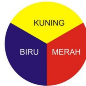
5. Lingkar Warna Primer.

2. Warna Sekunder merupakan percampuran dari warna primer atau warna pokok (Putraka, 2017). Warna-warna sekunder diantaranya adalah orange, ungu, dan hijau.