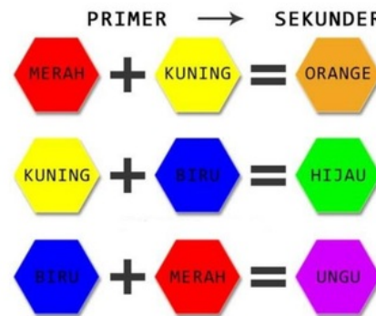
6. Warna Sekunder.

2. Warna Sekunder merupakan percampuran dari warna primer atau warna pokok (Putraka, 2017). Warna-warna sekunder diantaranya adalah orange, ungu, dan hijau.