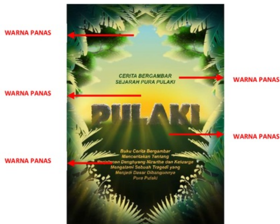
Poster Cerita Bergambar Sejarah Pura Pulaki

Pada poster cergam sejarah Pura Pulaki warna panas dominan digunakan pada ilustrasi bagian tengah pada poster, yaitu matahari, sinar, langit, daun-daun yang terkena sinar matahari dan teks bagian bawah. Berikut merupakan tampilan visual poster serta keterangan bagian yang menggunakan warna panas pada objeknya :