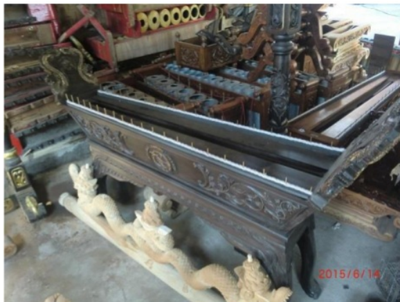
Gambar 6. Model Instrumen Gambang 14 Juni 2015