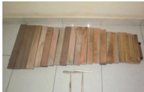
Gambar 1. Petuding Prototipe Gamelan Sistem 10 Nada Foto: Hendra Mei 2015