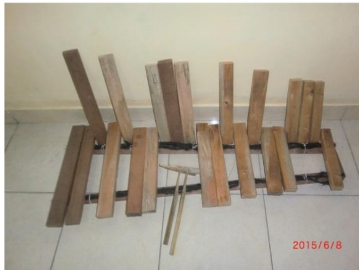
Gambar 4. Interval C Pelog 5 nada tanggal 7 Juni 2015

Setelah berdiskusi dengan Pande Cukrik maka Prototipe gamelan sepuluh nada ini akan mengambil format gamelan-gamelan kuno yang ada di Bali yaitu yang memadukan antara gamelan bahan logam dengan bilah bambu maupun kayu seperti gamelan Gambang dan gamelan Gong Luang.