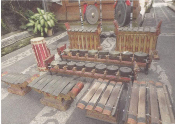
Gambar 5. Gong Luang Banjar Apuan Singapadu Foto Bandem, Gamelan Bali di atas Panggung Sejarah , halaman 227.