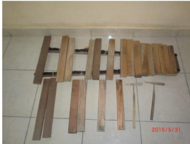
Gambar 2. Interval A Pelog 5 nada