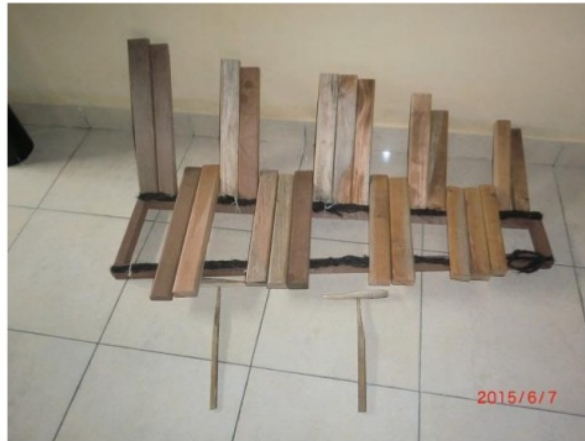
Gambar 3. Interval B Pelog 5 nada tanggal 7 Juni 2015

Berdasarkan percobaan pertama, ditemukan pula ragam laras diatonis, namun nada 2 (re) pada notasi Chever (angka) terkesan melayang atau tidak pas. Pola interval nada diatonis yang terliput dalam nada pada gamelan Nawa Swara ini adalah X – X X X X X – X X. Jikalau susunan nada diatonis ini diurutkan berdasarkan nada dasar pada notasi Sunda Buhun, maka diperoleh susunan 10 nada dasar seperti berikut ini.