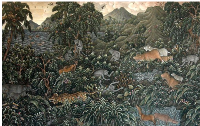
Gambar 1. I Wayan Taweng, 2016, Harmoni , 51 x 33 cm, akrilik pada kertas.

Banyak karya-karya seni lukis yang mengungkapkan dalam visualnya sistem kosmis Timur yang menjunjung nilai keselarasan, di mana intervensi manusia pada alam diatur sedemikian rupa agar terjaga suatu keharmonisan yang diyakini bakal menghasilkan situasi stabil bagi alam serta kemakmuran bagi manusia. Seni lukis tradisi gaya Ubud, gaya Batuan sampai seni lukis modern dan kontemporer banyak para senimannya mendasari kreativitas ketika berkarya berlandaskan pemikiran tentang kesinambungan ekosistem.