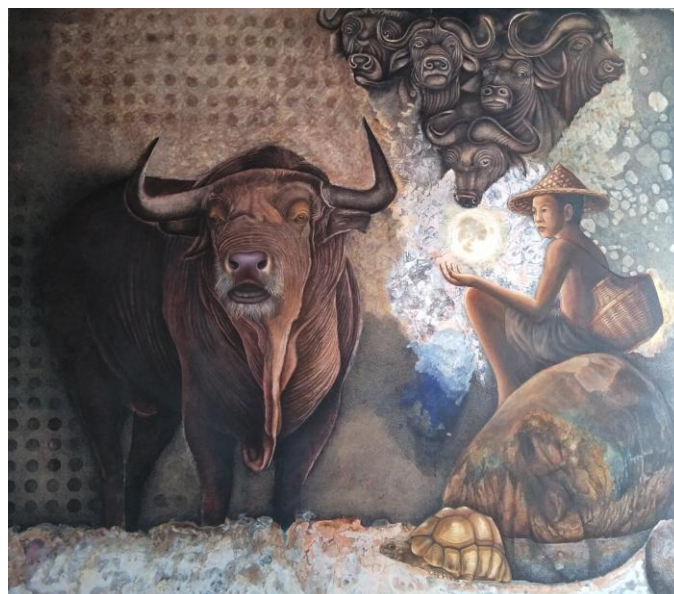
Karya 4. Lestari Bumiku , 2020, pen, cat akrilik, cat minyak pada kanvas, 160 x 140 cm.

Karya Lestari Bumiku , terdapat petanda dengan objek yang diacu, yaitu binatang sapi dan kepala sapi, nelayan muda membawa dungki (tempat tangkapan ikan), batu besar, kura-kura, nelayan, air sungai yang jenih dan bentangan langit sebagai ruang angkasa yang maha luas. Pemilihan warna yang cenderung warna monokromatik. Warna monokromatik merupakan perpaduan beberapa warna yang bersumber dari satu warna dengan nilai dan intensitas yang berbeda. Warna oker dikombinasikan dengan warna oker dengan nilai dan intensitas yang berbeda untuk menciptakan suatu perpaduan yang harmonis dan kesan alami.