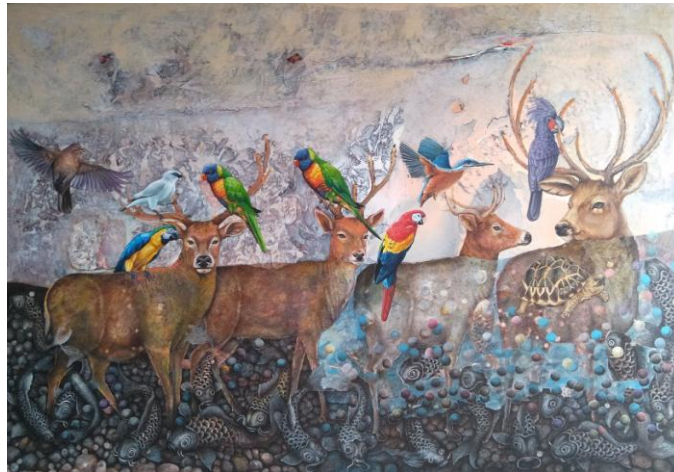
Gambar 3. Irama Alam , 2020, pen, cat akrilik, cat minyak pada kanvas, 160 x 140 cm.

Ulasan yang dilakukan hanya menyampaikan deskripsi karya, tetapi saya menyadari sebuah pemaknaan akan selalu bersifat arbitrer , dengan demikian pemirsa bebas menginterpretasikannya. Untuk lebih jelasnya akan dibahas sebanyak 2 karya dari 6 buah karya sebagai berikut: