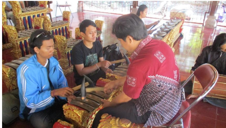
Pencarian motif-motif pukulan