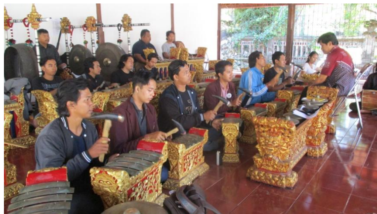
Penuangan materi bagian kawitan dan pengawak