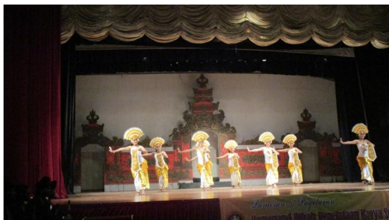
Penyajian karya tari yang diiringi gamelan