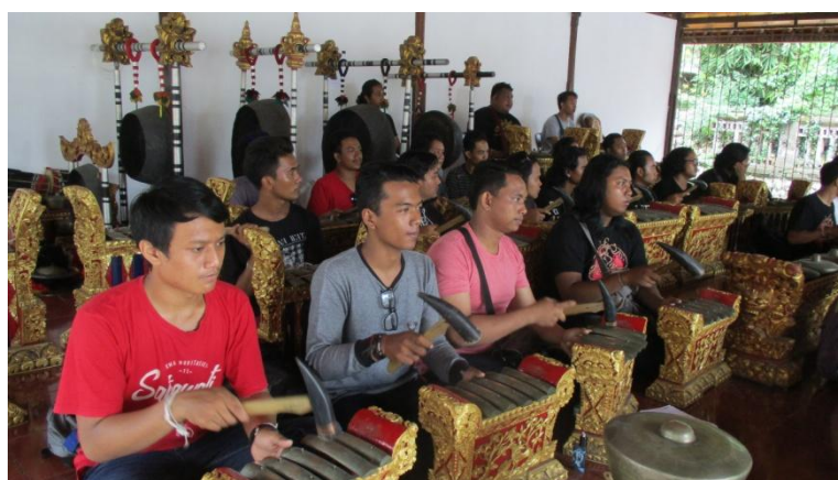
Proses pencarian gending