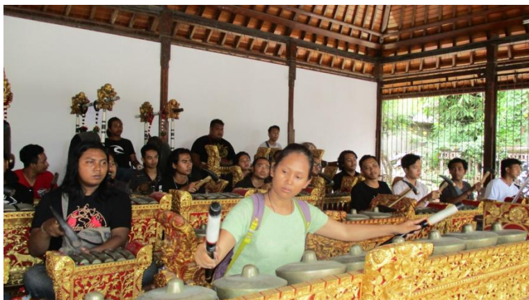
Proses pencarian gending