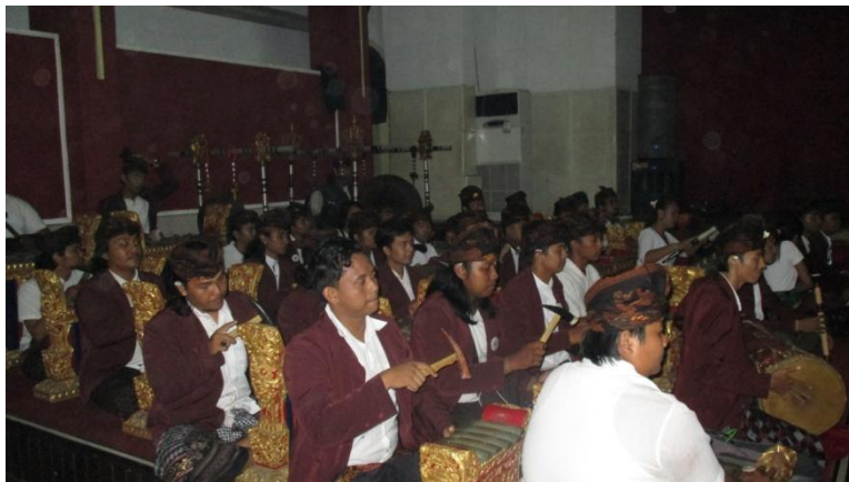
Saat Pagelaran karya seni