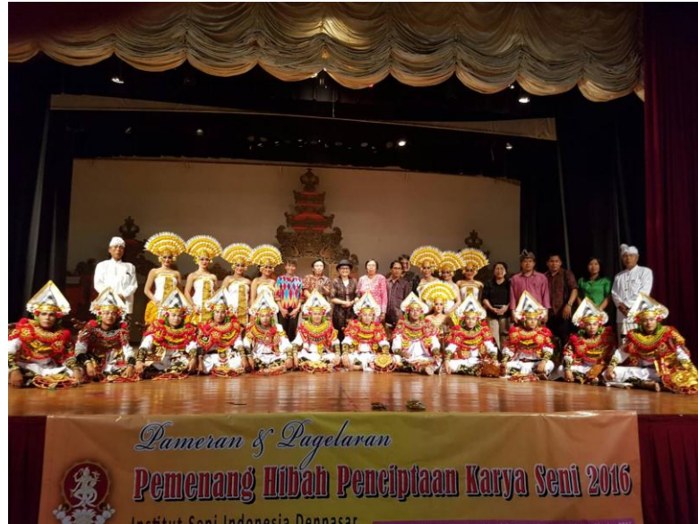
Foto bersama se usai pagelaran karya seni