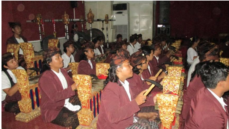
Foto pagelaran karya seni