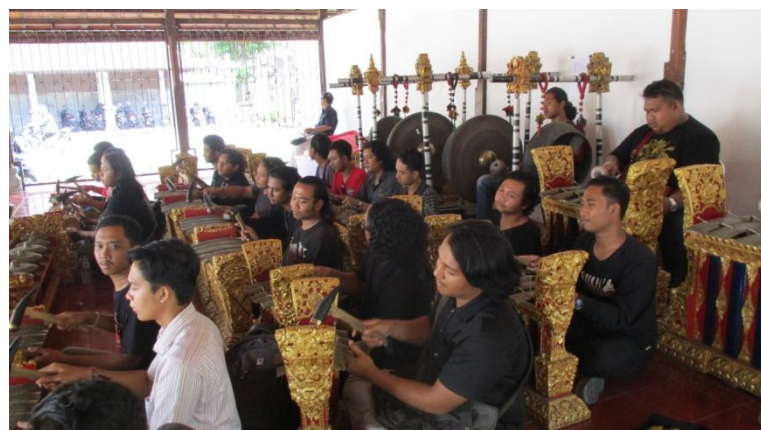
Proses pencarian gending