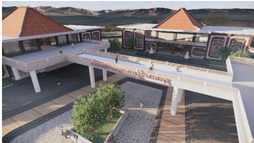
Gambar 7 Perspektif Fasad