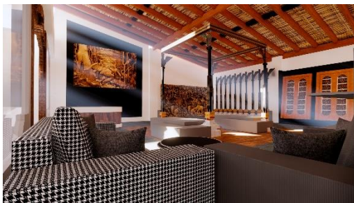
Gambar 4 Perspektif R. Seni Ukir

Gambar di atas merupakan ruang pameran atau ruang pajangan yang para pengunjungnya secara tidak langsung akan tertarik untuk melihat jenis produk seni yang dipajang pada area ini sebelum memasuki area shopping . Pada Ruangan ini dominan menerapkan material kayu agar tercipta keharmonisan seperti konsep titha kriya siwanda yang dimana memiliki hubungan yang harmonis.