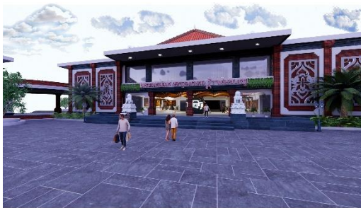
Gambar 7 Perspektif Fasad Gedung Seni Ukir

Pada desain ruang fashion dominan menggunakan warna putih dan coklat serta terdapat plafon ekspose agar lebih mencerminkan nuansa bali pada ruanga.