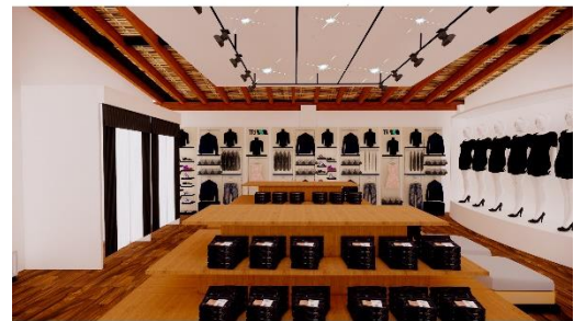
Gambar 5 Perspektif R. Fashion

digunakan untuk melihat gambar dari sudut pandang tertentu. Di bawah ini adalah gambar perspektif berupa 3D yang memperlihatkan suasana yang terdapat pada interior Pasar Seni Sanur Bali. Gambar dibawah ini merupakan area belanja dan ruang workshop seni ukir. Dimana ruangan ini dominan menggunakan warna putih, hal tersebut agar wisatawan dan peserta workshop dapat lebih fokus dalam belajar tanpa adanya benda atau objek yang mengganggu di sekitarnya.