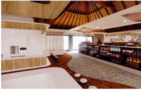
Gambar 6 Perspektif R.Foodcourt & Oleh-oleh

Pada desain ruang fashion dominan menggunakan warna putih dan coklat serta terdapat plafon ekspose agar lebih mencerminkan nuansa bali pada ruanga.