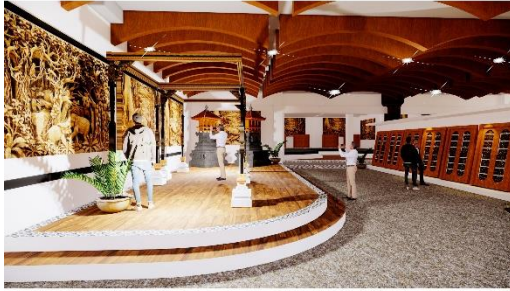
Gambar 3 Perspektif R. Pameran