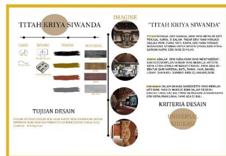
Gambar 1 Penjabaran Konsep (Sumber Dokumen Mahasiswa,2021)

Siwanda diambil dari Bahasa Sansekerta yang memiliki arti “Bumi”. Dalam hal ini yang di maksud bumi adalah budaya lokal di Bali yang berkaitan dengan karya produk kerajinan lokal. Lokal adalah budaya yang dimiliki oleh masyarakat suatu daerah yang menempati lokalitas yang menjadi strategi kehidupan yang berwujud aktivitas. Contohnya kerajinan tangan yang dibuat di suatu daerah dan di pasarkan didaerah sendiri.