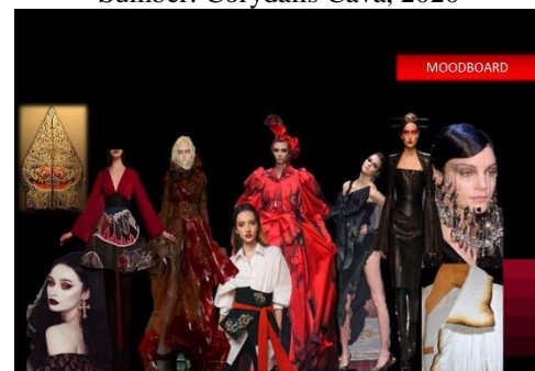
Gambar 2.12 Mood Board sebagai ide pembuatan desain