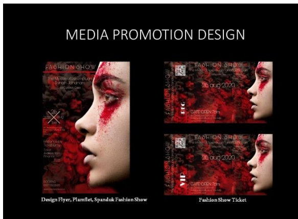
Gambar 4.7 Brosur dan Tiket Pagelaran Fashion Show

Langkah yang dilakukan pada tahap inidengancara mengadakan pagelaran fashion show , dan pameran. Pagelaran ini diabadikan dalam media social sehingga dapat dimanfaatkan kembali sebagai media promosi.