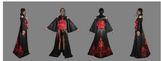
Gambar 4.5 Wujud Busana Houte Couture