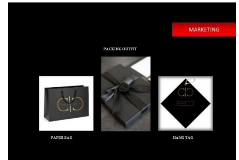
Gambar 4.9 Marketing

Untuk memastikan bahwa produk original dan merupakan produksi brand Corydalis Cava diciptakanlah sebuah label, price tag , kartu nama hingga instruction (cara merawat sebuah produk).