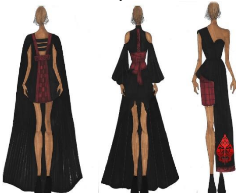
Gambar 3.3 (a) pilihan haute couture pertama, (b) pilihan haute couture kedua, (c) pilihan haute couture ketiga Design alternative busana Haute Couture

Design alternative busana Ready To Wear Deluxe