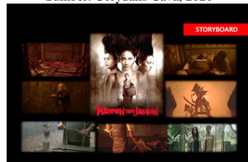
Gambar 2.11 Storyboard