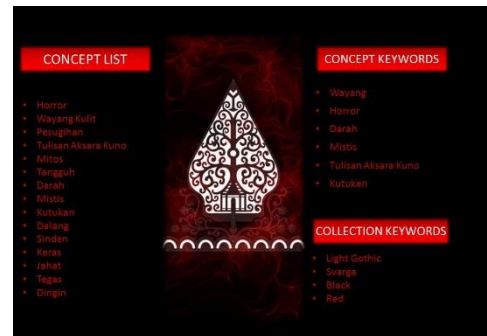
Gambar 2.10 Concept List & Keyword

Design development dalam Bahasa Indonesia diartikan sebagai desain pengembangan. Desain pengembangan adalah sebuah proses lanjutan dari langkah