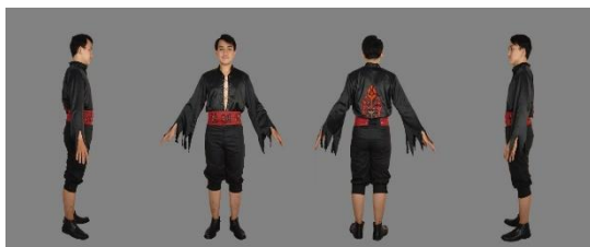
Gambar 4.3 Wujud Busana Ready to Wear Deluxe