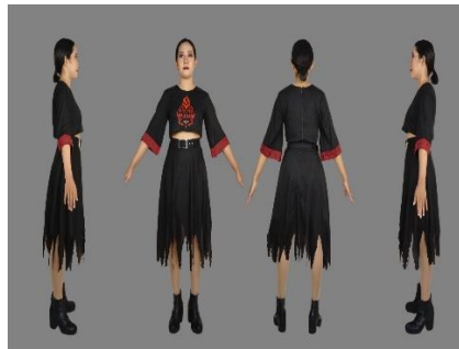
Gambar 4.1 (a), (b), (c), (d) Wujud Busana Ready to Wear