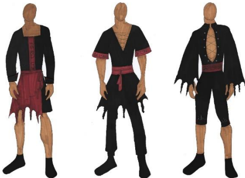
Gambar 3.2 (a) pilihan ready to wear deluxe pertama, (b) pilihan ready to wear deluxe kedua, (c) pilihan ready to wear deluxe ketiga

Design alternative busana Ready to Wear Sumber : Corydalis Cava, 2020