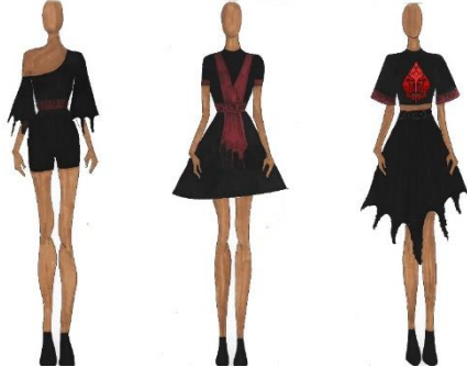
Gambar 3. 1 : (a). pilihan ready to wear pertama, (b) pilihan ready to wear kedua (c) pilihan ready to wear ketiga

Design alternative busana Ready to Wear Sumber : Corydalis Cava, 2020