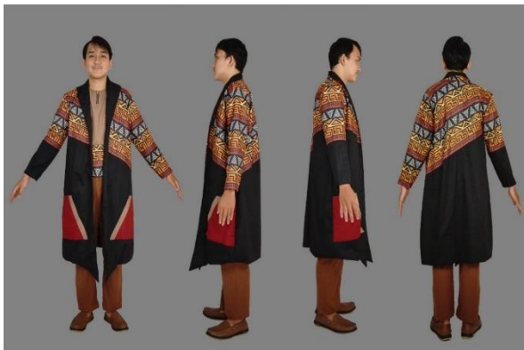
Gambar 4.2 Hasil Akhir Ready To Wear Sumber : Andini Aulyana, 2021

Ready To Wear merupakan istilah yang sering digunakan pada busana siap pakai yang dapat di produksi secara manual dalam jumlah yang banyak tanpa harus melakukan fitting. Koleksi busana Ready To Wear ini dibuat sesuai sketsa desain dengan ide film Gerbang Neraka. Diwujudkan sesuai keywords yang telah ditentukan saat tahap research dan sourcing . Berikut hasil akhir dan penjabaran metafora dari koleksi “ Mystical Story of Firegate ” busana Ready To Wear :