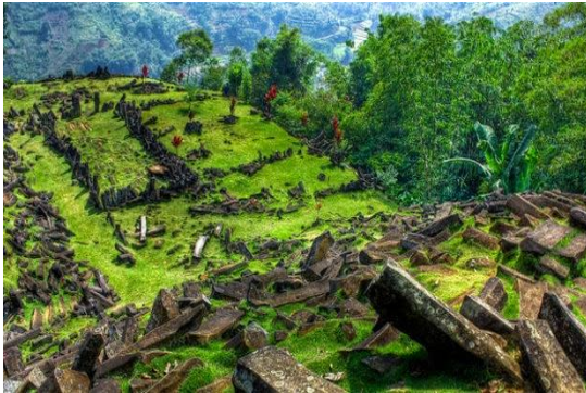
Gambar 2.1 Piramida Gunung Padang