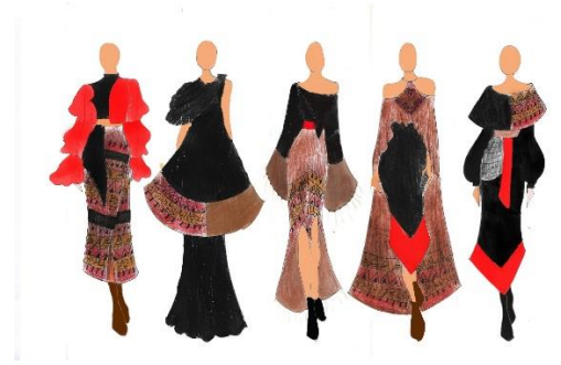
Gambar 3.1.2 Design Development Ready To Wear Deluxe