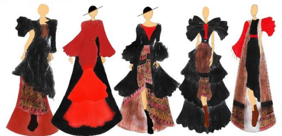
Gambar 3.1.3 Desain Development Houte Couture