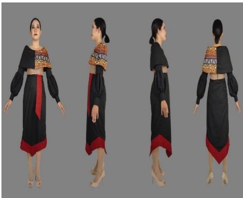
Gambar 4.4 Hasil Akhir Ready To Wear deluxe

Ready To Wear Deluxe merupakan busana yang memiliki sifat produksi massal seperti Ready To Wear , namun memiliki tingkatan yang lebih tinggi dan lebih sulit. Dibanding busana Ready To Wear , ada koleksi busana Ready To Wear Deluxe ini memiliki tingkat kesulitan yang lebih tinggi, pemakain teknik fabric printing dan . Berikut hasil akhir dari koleksi “ Mystical Story of Firegate ” dan juga penjabaran mengenai metafora yang terkandung dalam busana ini :