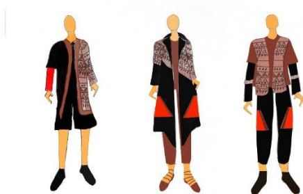
Gambar 3.1.1 Design Development Ready To Wear

Tahap final collection merupakan tahap akhir dalam penciptaan karya tugas akhir yang berjudul “ Mystical Story of Firegate ”: Metafora Film Gerbang Neraka Dalam Penciptaan Busana Ready To Wear , Ready To Wear Deluxe , dan Houte Couture . Ketiga busana ini didasari oleh satu konsep yang sama dengan tingkat kesulitan yang berbeda dan semakin meningkat sesuai jenisnya.