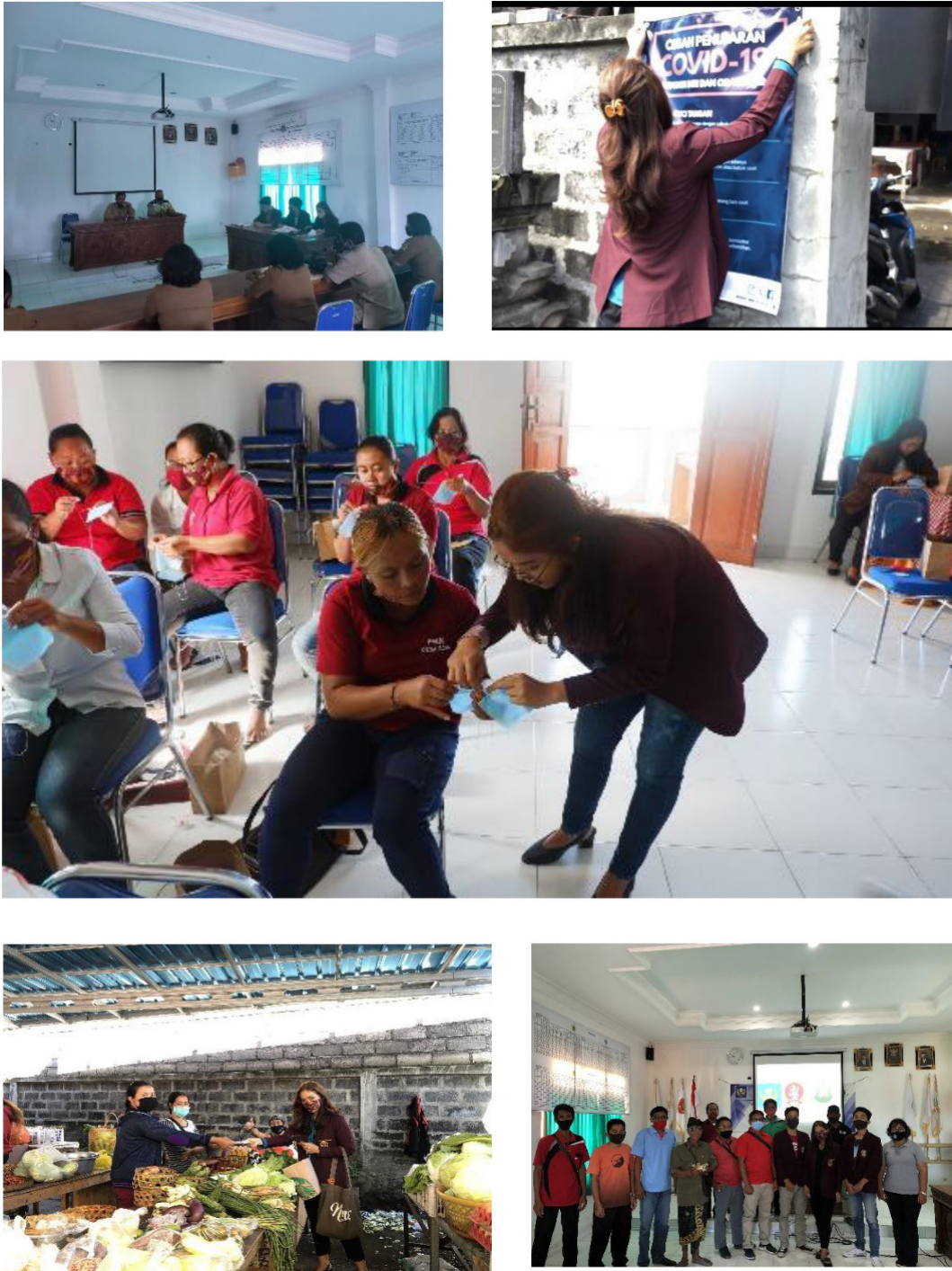
Gambar 1. Gambaran pelaksanaan kegiatan KKN ISI Denpasar di Desa Bona