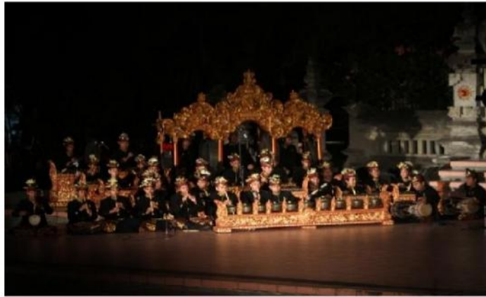
Gambar 5. Pentas Tabuh Lima Tapuk Manggis 23 Juli 2014 di Stage Nretya Mandala ISI Denpasar