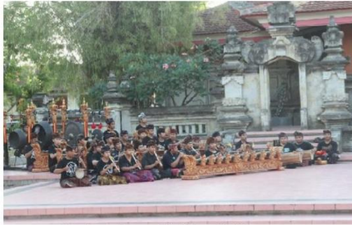
Gambar 1. Proses Gladi Bersih di Panggung Nretya Mandala ISI Denpasar 22 juli 2014