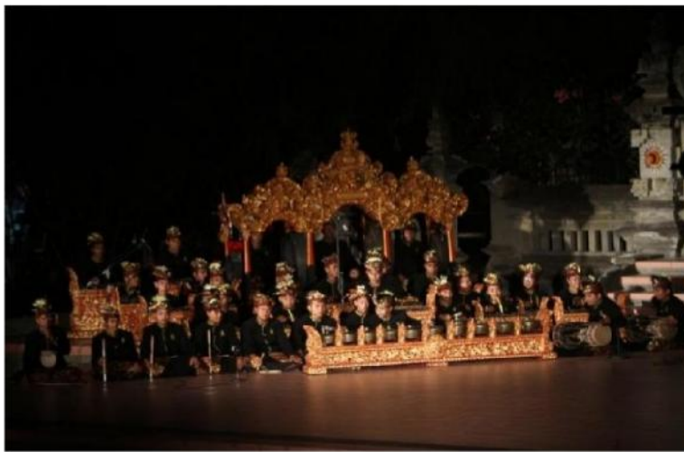
Gambar 4. Pentas Tabuh Lima Tapuk Manggis 23 Juli 2014 di Stage Nretya Mandala ISI Denpasar