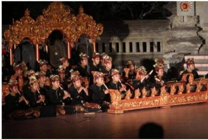
Gambar 8. Pentas Tabuh Lima Tapuk Manggis 23 Juli 2014 di Stage Nretya Mandala ISI Denpasar