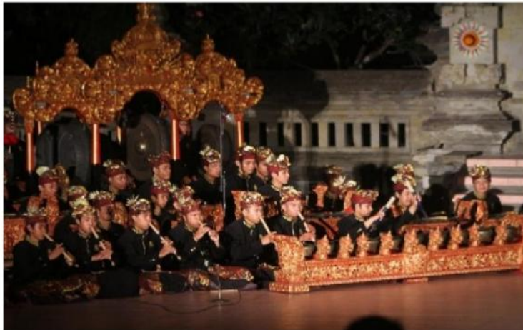
Gambar 6. Pentas Tabuh Lima Tapuk Manggis 23 Juli 2014 di Stage Nretya Mandala ISI Denpasar