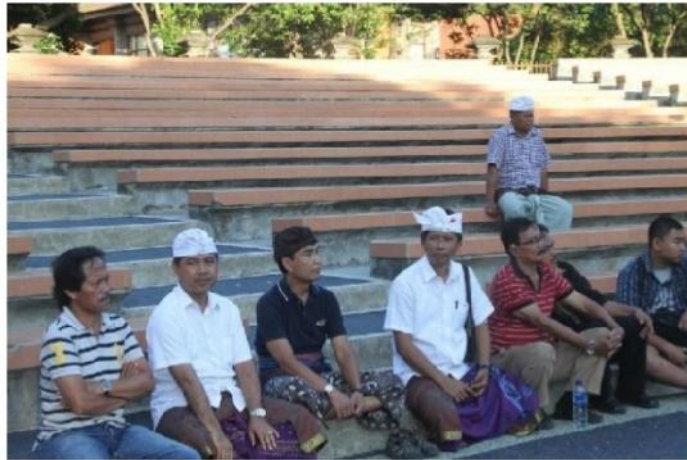
Gambar 2. Bapak Rektor didampingi PR IV dan Para Penggarap Menyaksikan Proses Gladi Bersih Penyajian Karya Terbaru di Panggung Nretya Mandala ISI Denpasar 22 Juli 2014