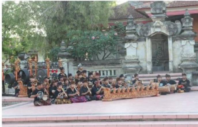
Gambar. Setting Instrumen Gong Kebyar