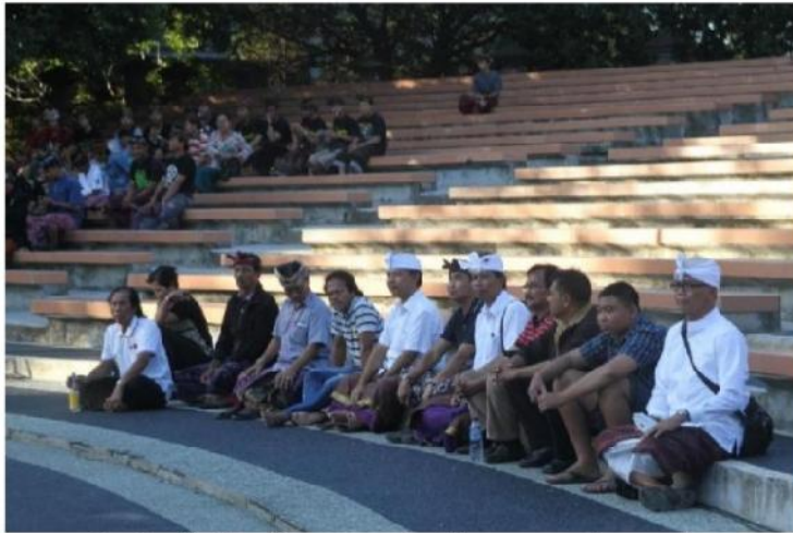
Gambar 3. Para Pengamat dan Penonton sedang serius menyaksikan Proses Gladi Bersih Penyajian Tabuh Lima Lelambatan Kreasi Tapuk Manggis