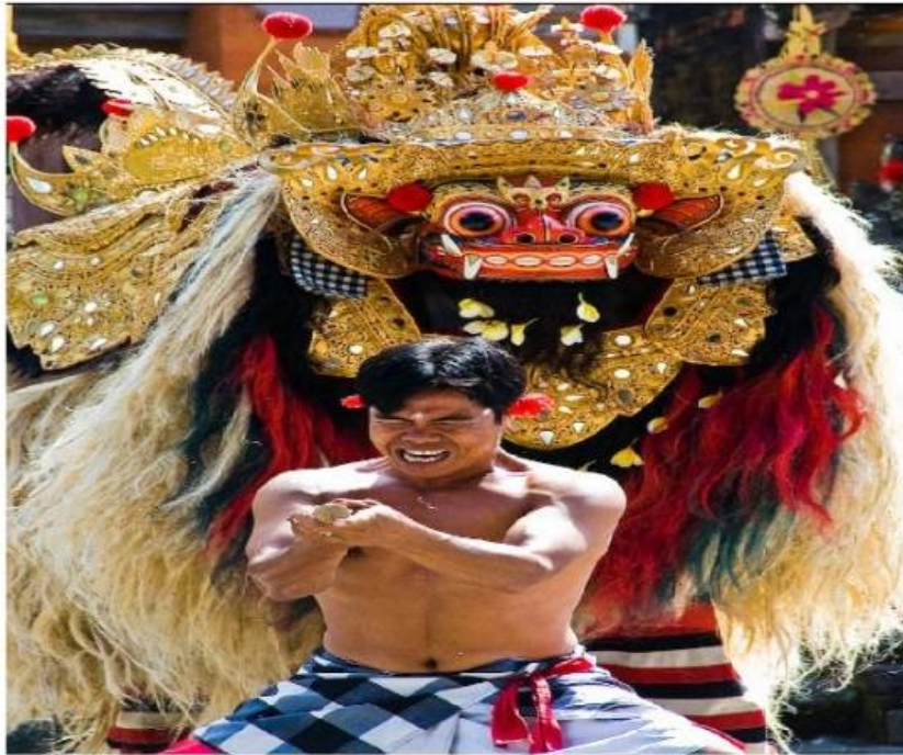
Tari Barong dan Keris

Indonesia. Pada awalnya tari ini merupakan pengganti pertunjukan singa sesungguhnya dalam sirkus oleh orang-orang yang mengadakan perjalanan, mengikuti festival, dan mencari dana.