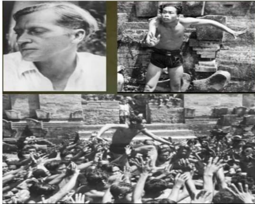
Walter Spies dan Cak Bedulu

tetapi menggunakan cerita Mahabharata dan yang lainnya, sehingga Caknya sendiri dianggap sebagai musik pengiring.