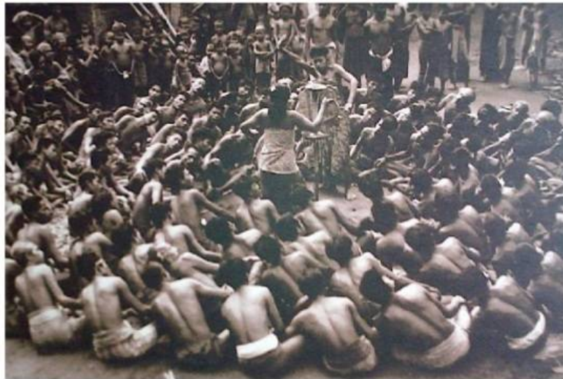
Cak Bedulu