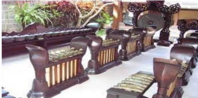
Gamelan Semara Pagulingan (Dok. Istimewa)