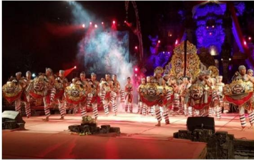
Okokan Tegalalang (Dok. Istimewa)

Atas prakarsa masyarakat Baturiti (kabupaten Tabanan) dan Tegalalang (Kabupaten Gianyar) di mana terdapat cukup banyak instrumen okokan , alat-alat bunyi ini ditata menjadi sebuah barungan yang disebut Okokan atau Grumbungan . Di Daerah Gianyar Okokan ini berkembang di daerah Pujung Tegalalang.