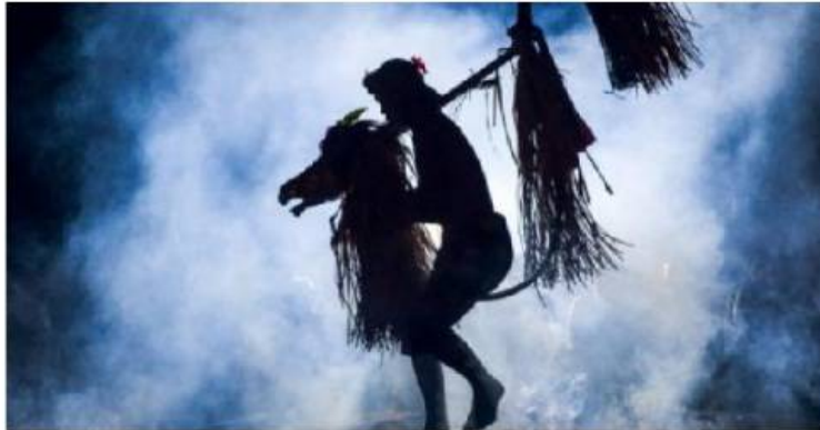
Tari Sanghyang Jaran

Karakteristik masyarakat Bali Kuna sebelum masuknya sistem kerajaan adalah kebersamaan, yaitu segala sesuatu diputuskan bersama, berdasarkan musyawarah mufakat di antara tetua adat dan masyarakat. Landasan musyawarah dan mufakat itu adalah rasa kebersamaan dalam mempertahankan keutuhan tradisi dan nilai kemasyarakatan . Tradisi dalam masyarakat Bali Kuna, didasari oleh kepercayaan pada kekuatan alam. Menurut Laeyendecker (1983:11), kesadaran yang kuat terhadap tata kosmos yang diciptakan dan dipelihara oleh Tuhan menyebabkan sikap kolektivitas lebih kuat daripada sikap individu . Tata kosmos dalam hal ini adalah keteraturan alam yang sangat berpengaruh pada kehidupan manusia. Keteraturan alam yang dimaksud dalam hal ini antara lain, siang dan malam , panas dan dingin , hujan dan kemarau , semuanya ditata oleh Tuhan. Atas dasar pemikiran Layendecker itu, masyarakat Gianyar pada jaman para Hindu mempercayao keteraturan alam sebagai kehendak Tuhan dan mengutamakan kebersamaan dalam segala hal. Hasil kreativitas seni dianggap sebagai hasil bersama, sehingga seni bukan untuk kepentingan individu tetapi diciptakan bersama untuk memuja