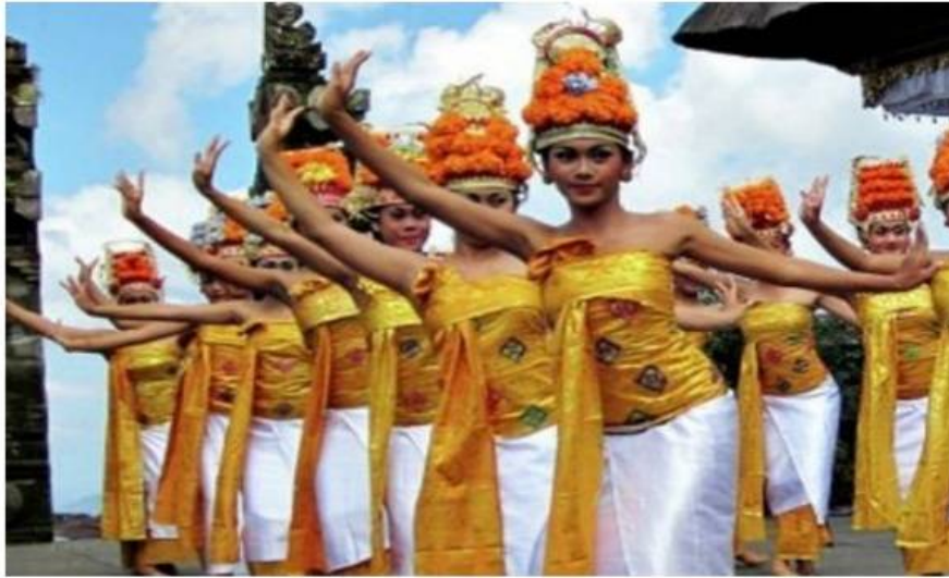
Tari Rejang Dewa