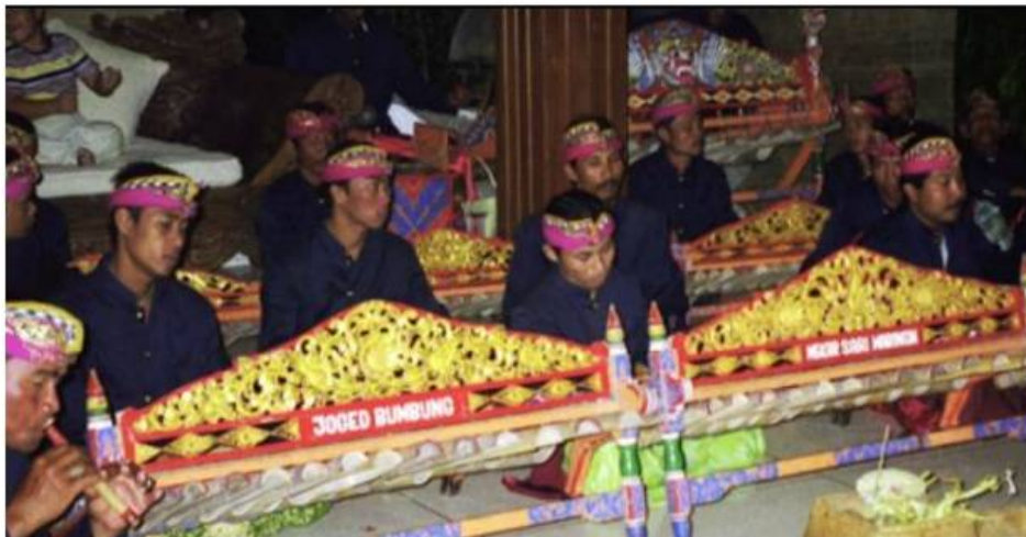
Gamelan Joged Bumbung

sudah dilengkapi dengan grantang (rindik) suwir dan grantrang jegog. Fungsi gamelan ini untuk mengiringi tari pergaulan yang disebut joged karena diringi dengan bumbung bambu maka disebut joged bumbung. Tarian ini berfungsi sebagai hiburan masyarakat yang biasanya disajikan usai musim panen.gamelan ini pada jaman dahulu terdapat di Desa Bukit Jangkrik (Gianyar), Tegal Tamu, Batubulan (Sukawati).