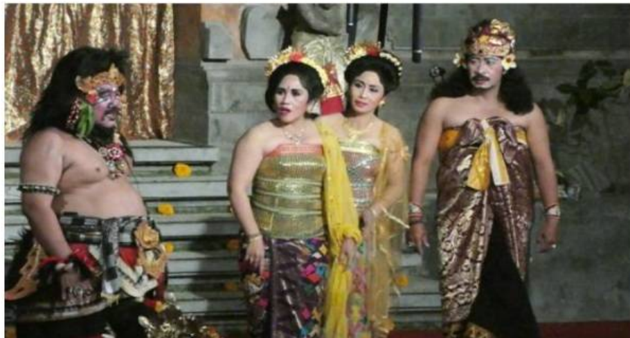
Drama Gong

bonan , tidak nyebun seperti Abianbase antara lain, Drama Gong Duta Bon Bali, Bintang Bali Timur, dan Drama Gong Sancaya Dwipa. Berkembangnya Drama Gong tersebut telah mampu mengalahkan popularitas tari Arja yang juga berkembang sangat pesat sekitar tahun 1970, sampai tahun 1980-an.