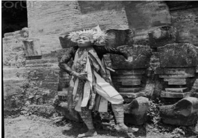
Tari Baris