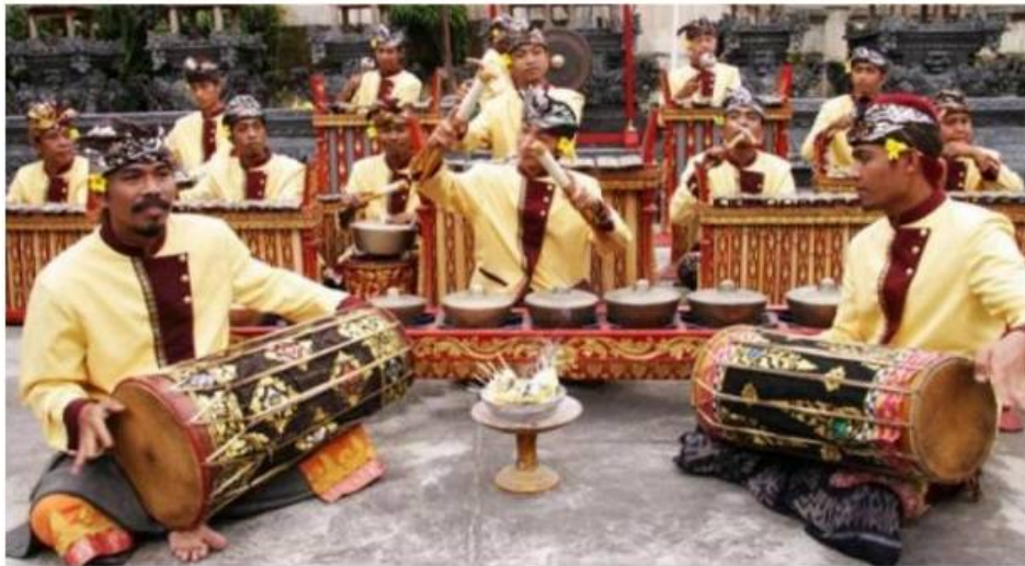
Gong Luang

Gamelan gong luang merupakan barungan gamelan pertama yang dapat dianggap paling lengkap, karena telah menggunakan beberapa instrument yang sudah ada sebelumnya. Kelengkapan instrumen itu dapat dicermati dari terpadunya instrument berbentuk bilah seperti, gangse jongkok, saron dan gambang (bilah bambu) dengan instrument berbentuk pencon seperti, tromping, kempur, dan gong. Instrumen kendang juga sudah dimasukan ke dalam barungan gong luang hanya saja fungsinya terbatas hanya sebagai aksentuasi menjelang jatuhnya pukulan gong dalam akhir sebuah lagu.