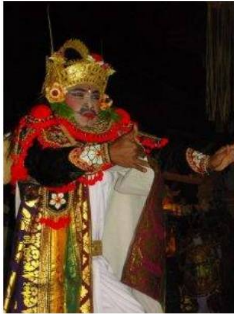
Gb. Tokoh Arya dalam Gambuh

Memasuki zaman kemerdekaan, seni pertunjukan Gambuh memang beralih fungsi dari kesenian istana menjadi seni pentas ritual keagamaan. Penampilan dramatari Gambuh selain dimaknai sebagai presentasi estetik namun juga menjadi kelengkapan upacara keagamaan. Dalam suasana komunal dan atmosfer yang religius, generasi tua dan muda para partisipan upacara keagamaan itu menyaksikan teater tradisi yang amat jarang dipentaskan itu.