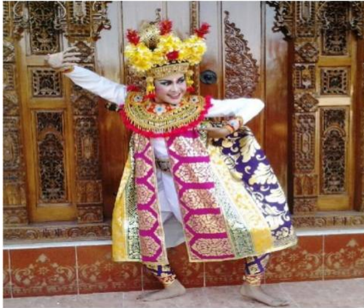
Tokoh Mantri dalam Arja (Dok. Suartaya)

Seni pertunjukan arja adalah sebuah opera Bali yang elemen utamanya terdiri dari tari, drama, dan nyanyian. Penyajian seni pentas musikal teater ini protokoler. Setiap tokoh melantunkan tembang tersendiri sesuai dengan wataknya ketika baru pertama muncul dalam sebuah pementasan. Kendati lakonnya berbeda namun struktur dramatik teater ini baku. Dan pola yang lazim dalam seni pentas arja, di akhir cerita tokoh zalim pasti dapat dikalahkan oleh pahlawan kebenaran.