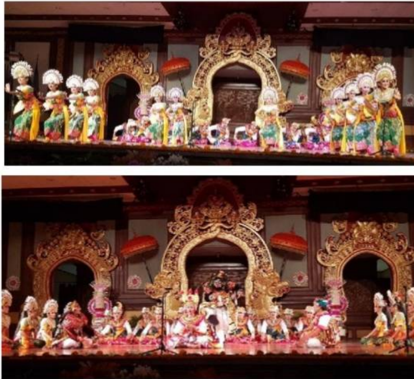
Pementasan Janger Peliatan Pada PKB ke-41 Th 2019 di Taman Budaya Denpasar (Dok. Sudirga, 2019)

sehingga berbagai kemasan Janger muncul dengan versinya masing-masing seperti Janger Dag yang mendapat pengaruh dari komedi stambul dan busana seperti Tentara Belanda, Janger klasik (sesaputan), janger berpola drama, dan sebagainya.