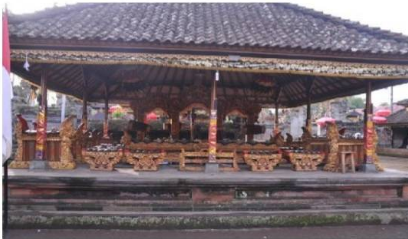
Gambar. Gamelan Gong Gede

( lelambatan ) dan mengiringi tari-tarian upacara seperti Baris dan Rejang.