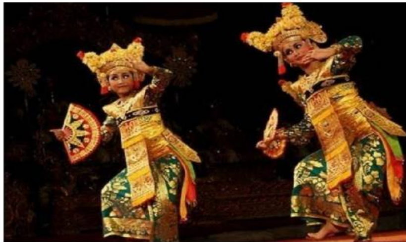
Tari Legong Keraton