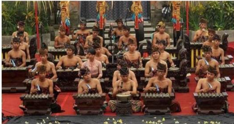
Gong Gede Saih Pitu

diskusi di Balai Banjar Kebon, Darya mengusulkan ide jika ada dana agar membeli sebuah gamelan Gong Gede Saih Pitu. Ketika ide dilontarkan seponan masyarakat menyetujui dan keesokan harinya sudah memesan kepada Mangku Pager pande gamelan dari Desa Blahbatuh.