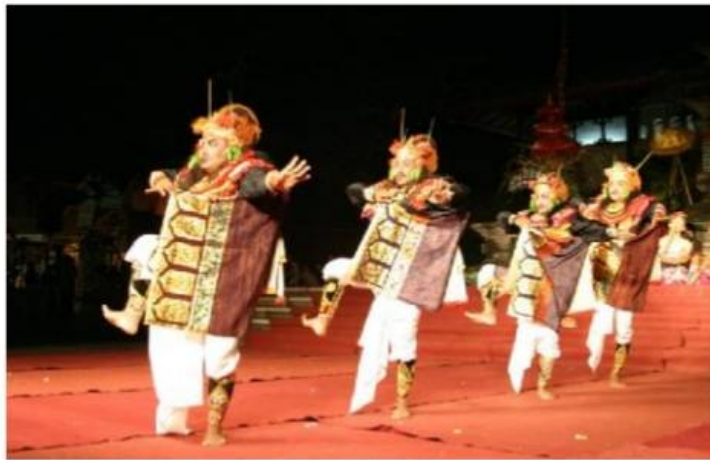
Dramatari Gambuh Batuan

Untuk menghadirkan nilai, simbol dan norma tersebut, maka kreativitas seni pertunjukan mulai memasukan cerita. Melalui cerita akan dapat dinarasikan kebesaran raja, moral, nilai agama yang dianut oleh seorang raja dalam menjalankan kekuasaan. Oleh karena itu berbagai jenis seni pertunjukan bercerita dapat diasumsikan muncul pada jaman kerajaan, terutama jaman kerajaan Bali ketika masuknya pengaruh Majapahit. Salah satu seni pertunjukan itu, adalah dramatari Gambuh yang sangat subur perkembangannya di daerah Gianyar. Dramatari Gambuh, sumber ceritanya adalah cerita Panji yang diperkirakan muncul pada masa kejayaan Majapahit. Pada waktu itu, Raja Hayam Wuruk disebut sebagai salah seorang penari yang pandai memerankan tokoh Panji. Disamping itu juga berkembang dramatari Wayang Wong di Gianyar yang menggunakan sumber cerita dari epos Mahabarata dan Ramayana.