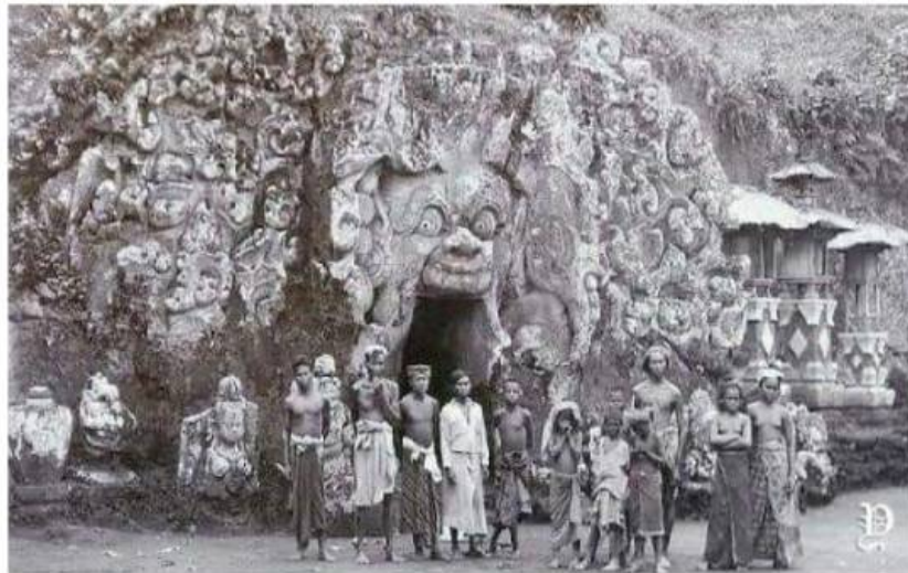
Candi Goa Gajah

sosial ( societifac ), merupakan fakta sosial tentang keberadaan seni pertunjukan yang ada saat ini. Sumber kebendaan ( artefac ) cukup banyak ditemukan pada relief-relief Candi dan peninggalan arkeologi lainnya disepanjang sungai petanu dan pakerisan dapat memberikan informasi tentang perkembangan seni kria, lukis dan juga seni pertunjukan melalui adegan-adegan yang dilukiskan. Sumber pemikiran ( mentifac ) tentang kebijakan raja banyak ditemukan dalam prasasti yang memuat berbagai jenis seni pertunjukan dan klasifikasi seni antara seni istana dan seni kerakyatan. Sumber sosial ( Societifac ), adalah bukti seni pertunjukan sebagai warisan sejarah masih hidup dan berkembang di Gianyar.