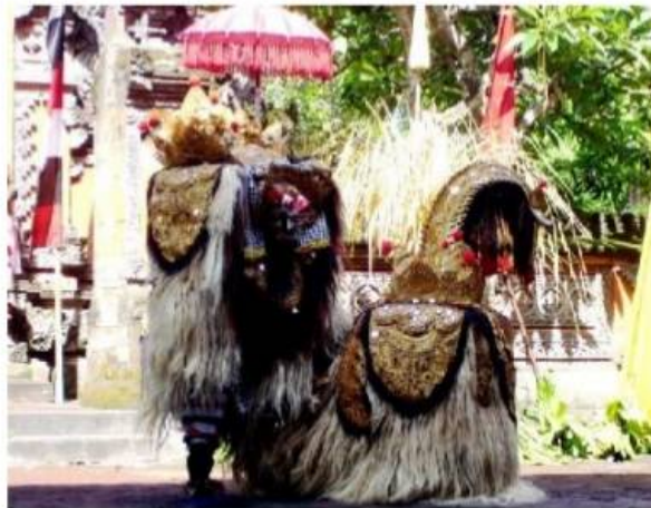
Gb. Tari Barong Ket