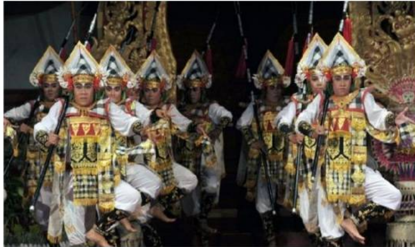
Tari Baris Gede (Dok. Istimewa)

Tujuh penari Tari Baris Tamyang mewakili karakter-karakter yang terlibat dalam kisah Abimanyu dalam menyerang formasi gelar cakra yang mana formasi ini merupakan formasi pertahanan militer pasukan Korawa . Dikisahkan dalam perang Mahabharata , Abimanyu menyerang pasukan militer Korawa yang melakukan formasi gelar cakra untuk melidungi dan menguatkan barisan untuk menyerang musuh. Namun Abimanyu tidak sembarangan dalam melakukan penyerangan dengan seorang diri tersebut, Abimanyu telah mengetahui cara memasuki formasi gelar cakra tersebut dengan mendengarnya kala itu Abimanyu masih didalam rahim Suprabha /ibunya. Pada saat itu (didalam rahim) Abimanyu sudah sadar dan mampu bercakapan dengan kedua orang tuanya ( Arjuna dan Suprabha ) hal itu membuat Arjuna membisikkan ilmu-ilmu kemiliteran kepada Abimanyu termasuk cara menembus formasi gelar cakra . Namun konon disaat