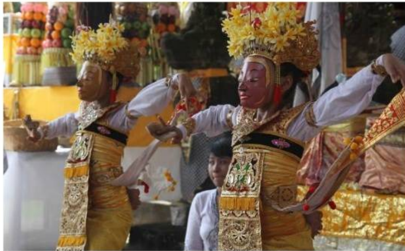
Tari Sanghyang Topeng Pura Payogan Agung (Doks. Istimewa)

masing pura yang ada di desa sekabupaten Gianyar memiliki jenis seni pertunjukan tari Sanghyang . Di Pura Penataran Sasih Desa Pejeng merupakan pura warisan jaman Bali Kuna, selalu digelar tari Sanghyang setiap ada upacara piodalan, begitu juga di beberapa pura di Ubud, di Pura Goa Gajah Desa Bedulu, di Desa Bona, Blahbatuh yang juga memiliki tari Sanghyang Dedari dan Sanghyang Jaran , di desa Camanggon Sukawati juga setiap tahun sekali digelar tari Sanghyang Dedari , di Pura Payogan Agung desa Ketewel, juga ada tari Sanghyang yang disebut dengan Sanghyang Legong atau Sanghyang Topeng .