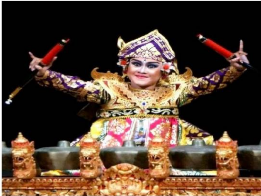
Tari Kebyar Palawakya

hingga kini masih segar bugar di Gianyar. Begitu pula Gong Kebyar yang lahir di Bali Utara, justru berkembang amat semarak di sini.