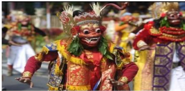
Dramatari Wayang Wong

Penyajian Parwa Sukawati masa itu disuguhkan dengan tata busana dan tata rias muka yang sederhana. Semua penari menggunakan busana yang sederhana tanpa sama sekali ada polesan ornamen kuning emas praba. Gelungan dan tapel (punakawan Malen, Merdah, Delem dan Sangut) merupakan warisan yang kurang terawat. Demikian pula tata rias mukanya menggunakan bahan-bahan alami seperti pamor untuk warna putih, adeng atau mangsi untuk warna hitam, dan daun base untuk warna merah. Kendati dengan serba seadanya, ekspresi seni tari dan tabuh yang dipersembahkan hadir mantap.