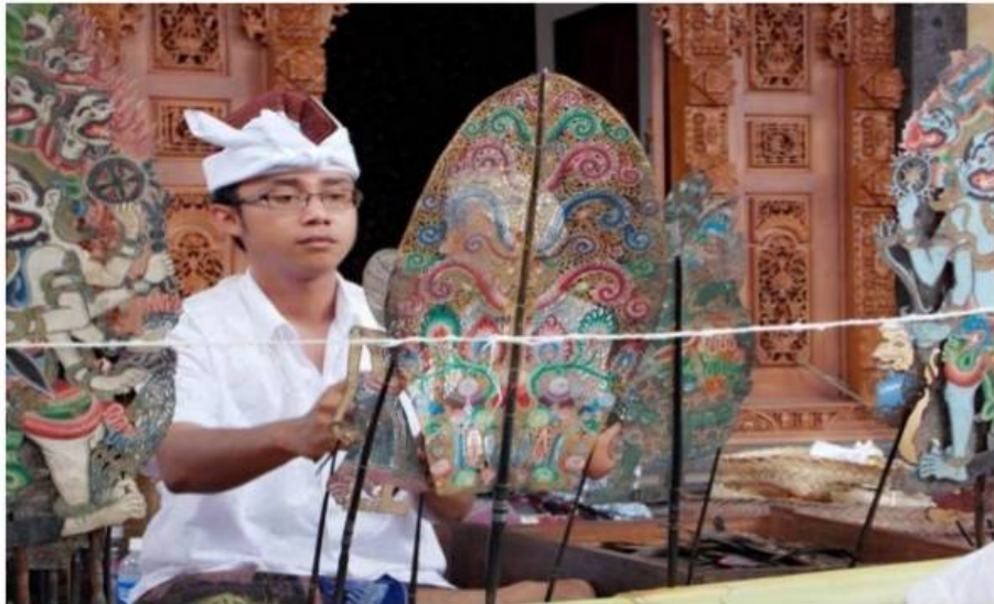
Wayang Kulit Sukawati

yang disebut terakhir adalah dalang-dalang muda yang sempat mengenyam pendidikan formal pedalangan pada Sekolah Tinggi Seni Indonesia (STSI) Denpasar. Dalang angkatan tahun 2000 adalah dalang cilik I Bagus Bharatanatya.