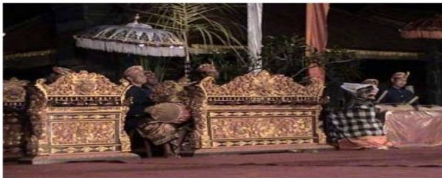
Gamelan Gandrung (Dok. Suartaya)

walaupun tergolong sebagai bentuk tari pergaulan tetapi di dalam praktiknya menunjukkan perbedaan yang sangat menjolok dengan tari Joged bumbung pada umumnya. Tarian sejenis ini di daerah kabupaten lainnya lebih umum dikenal dengan Gandrung seperti di Ketapian dan Monang -Maning (Denpasar). Satu hal yang khas dalam tari joged pingitan adalah bahwa ketika sampai pada adegan ibingan-ibingan antara penari Joged dengan pengibing tidak boleh mendekat secara bebas leluasa, karena mereka di dalam menari dibatasi oleh ruang pembatas yang disimbolkan dengan lampu yang terbuat dari lampu sentir yang sumbunya diletakkan pada buah kelapa berisi minyak untuk pemegangannya.