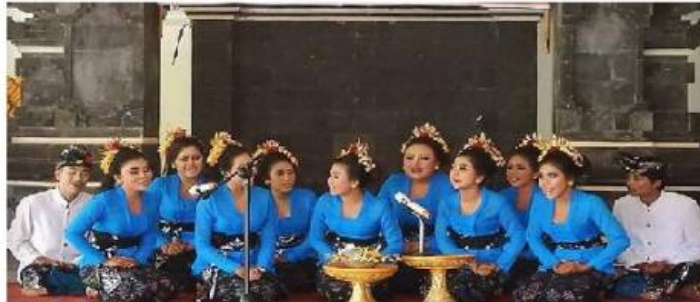
Sekaa Kidung (Dok. Istimewa)

kata dan bunyi akhir pada setiap bait dari pada jumlah suku kata dan bunyi akhir pada setiap larik atau baris.