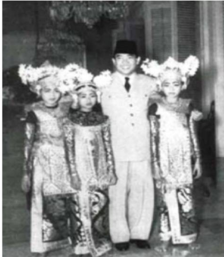
Bung Karno dengan para penari Legong

Kunjungan pejabat negara ke Gianyar selalu memicu berkembangnya berbagai kreativitas seni dan yang paling pokok dipikirkan oleh para seniman seni pertunjukan adalah menciptakan tari penyambutan agar tidak menggunakan tari sakral. Tari pendet adalah tari Sakral, sehingga muncul tari Gabor yang diciptakan oleh I Gusti Gede Raka dari Saba, Gianyar, yang kemudian di sepuhkan lagi, terutama tabuhnya oleh bapak I Wayan Berata. Dengan adanya pergolakan politik tahun 1964, antara Partai Komunis Indonesia (PKI) dengan Partai Nasionalisme Indonesia, muncul seni pertunjukan