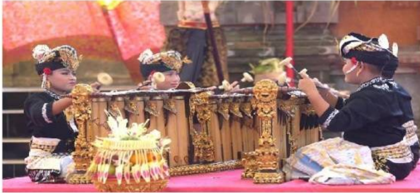
Gender Wayang

Barungan gamelan geder wayang terdiri dari empat tungguh yaitu dua tungguh pemade dan dua tungguh kantil. Gamelan ini dibuat dari perunggu dengan sepuluh bilah, dengan laras selendro dengan teknik pukulan dua tangan, resonatornya terbuat dari bamboo dan sistem larasnya menggunakan sistem ngumbang ngisep.