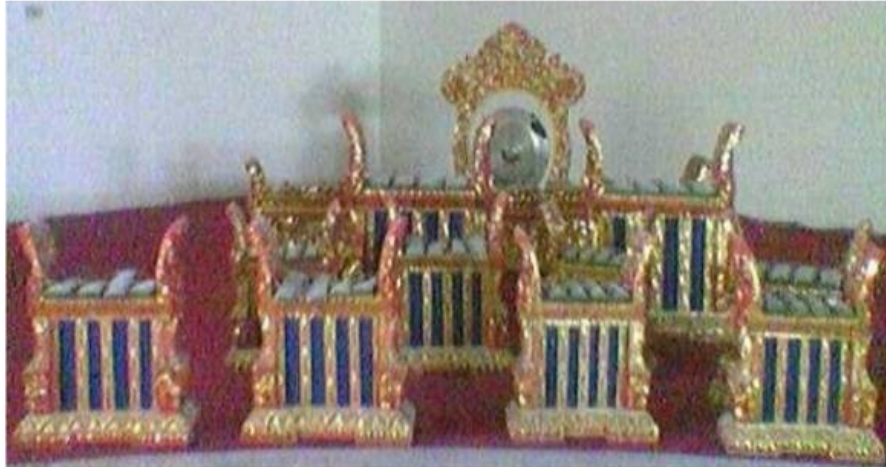
Gamelan Angklung

hingga 7 sampai 8 bilah. Gamelan sejenis ini kini lazim disebut sebagai Angklung Kebyar, yang mana mengadopsi permainan pola kekebyaran dalam teknik permainan gamelan angklung. Daerah-daerah basis angklung di Gianyar adalah Desa Sidan (Gianyar), Sayan, Kedewatan, dan Ubud.