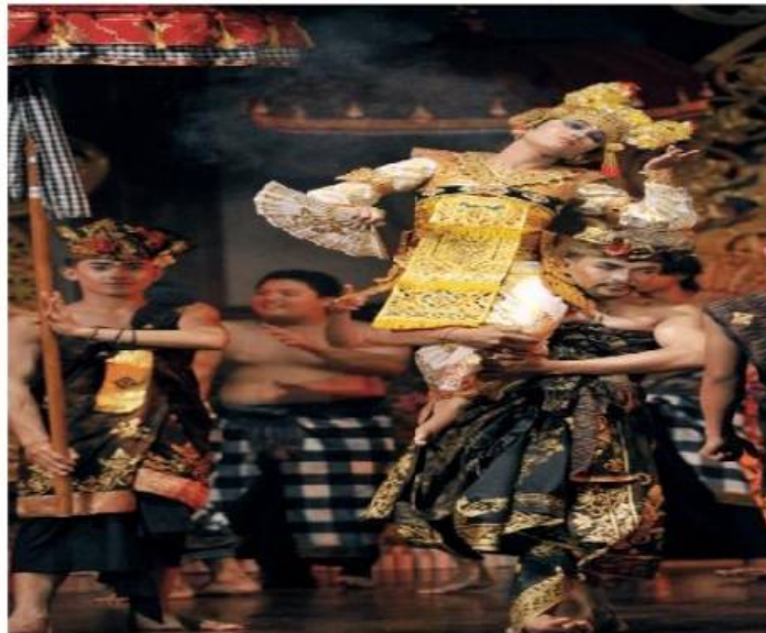
Tari Sanghyang Dedari (Dok. Istimewa)

Jika tahap ini sudah terlewati barulah mulai dengan upacara nusdus alias mengasapi. Asap menyan menyepul menyelimuti tubuh calon penari sanghyang. Lagu suci kuskus arum yang dikumandangkan koor wanita mengiringi berulang-ulang. Tanda-tanda kerauhan diketahui bila para penari mulai gemetar dan tak terkendali. Bila sudah trance , Sanghyang Jaran misalnya, menerjang api dan menendang kesana kemari, koor lagu kian bersemangat berkumandang. Sepanjang lagu dikumandangkan, penari Sanghyang akan terus bergerak yang kadang-kadang jauh di luar arena pentas, seolah-olah mengejar atau mengusir sesuatu.