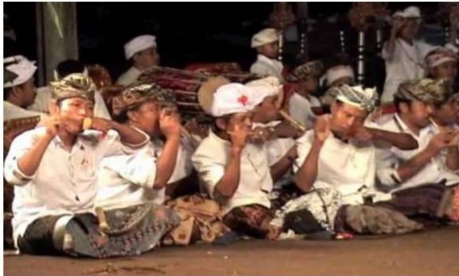
Gamelan Genggong

atas jelaslah bahwa Genggong adalah alat musik yang muncul sebagai akibat peniruan bunyi. Alat musik ini tergolong tua dan telah tersebar di seluruh dunia dengan bermacam bentuk dan versi. Khususnya di Desa Batuan, musik ekologis ini -karena bersumber dari bahan yang ada di lingkungannya- muncul dan dikembangkan melalui pertemuan tidak resmi atau waktu-waktu tarluang oleh para petani Desa Batuan zaman dulu melalui acara minum tuak.