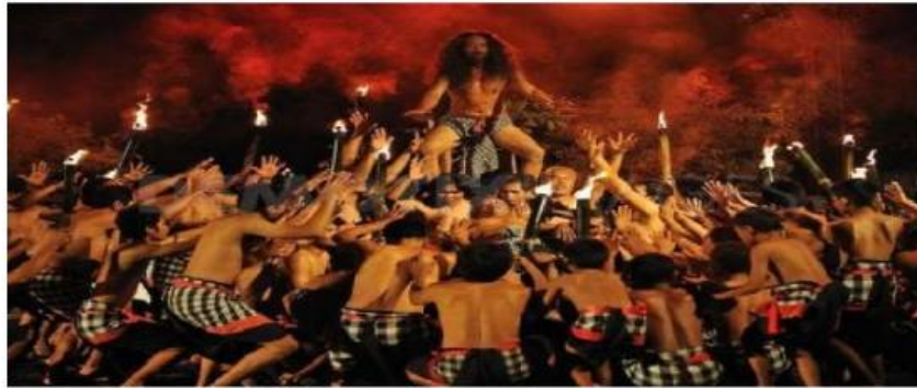
Tari Cak Teges Kangingan (Dok. Istimewa)

dengan pujian bertubi-tubi para tokoh seni setempat. Para seniman dari Gianyar ini adalah peristis lawatan-lawatan kesenian Bali ke mancanegara berikutnya.