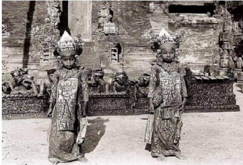
Tari Legong

Berdasarkan penjelasan di atas maka tari Legong diciptakan di Sukawati, Gianyar sebagai kesenian Puri yang kemudian berkembang ke seluruh Bali. Nilai estetika tari Legong sangat tinggi, sehingga tari Legong dapat dianggap sebagai identitas tari Bali. Dikatakan sebagai identitas tari Bali, karena setiap tari Bali yang ditarikan oleh wanita baik itu, tari pendet, Tari oleg, tari panyembrahma, dll, disebut tari Legong, pada hal tidak ada tari Legongnya. Kantong-kantong seni pertunjukan yang ciptaanya menyebar keseluruh Bali bahkan dunia berada di daerah Gianyar, seperti Singapadu dan Kuaramas dengan Arjanya, Saba dan Peliatan dengan tari Legongnya.