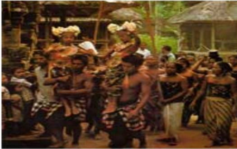
(Ilustrasi: Foto Tari Sanghyang Dedari)

Sebelum menari, kedua gadis tadi diupacarai untuk memohon datangnya Hyang Dedari ke dalam badan kasar mereka. Prosesi diiringi dengan paduan suara gending Sanghyang yang dilakukan oleh kelompok paduan suara wanita dan pria. Kedua gadis itu kemudian pingsan, tanda bahwa Hyang Dedari telah merasukinya. Kemudian beberapa orang membangunkan dan memasang hiasan kepalanya, kedua gadis dalam keadaan tidak sadar, dibawa ke tempat menari. Di tempat menari, kedua gadis kecil itu diberdirikan di atas pundak dua orang pria yang kuat. Dengan iringan gamelan Palegongan, kedua penari menari-nari di atas pundak kemudian si pemikul berjalan berkeliling pentas. Gerakan tarian yang dilakukan mirip dengan tari Legong . Selama tarian berlangsung, mata kedua gadis itu tetap tertutup rapat. Menari di atas bahu seseorang tanpa terjatuh, tidak mungkin dilakukan oleh gadis-gadis cilik dalam keadaan sadar, apalagi biasanya si gadis belum pernah belajar menari sebelumnya. Sungguh menakjubkan. Tarian suci ini diadakan dalam upacara memohon