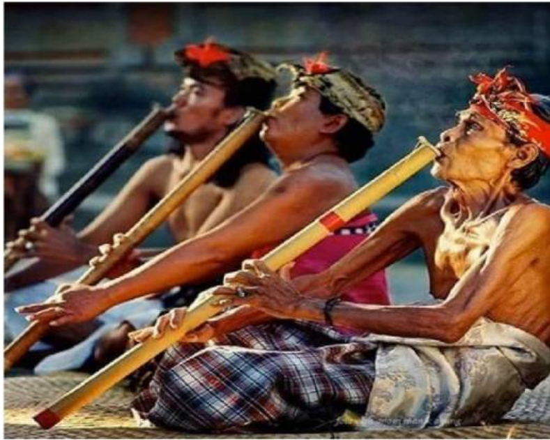
Suling Pagambuhan yang panjangnya hingga 1 meter merupakan ciri khas dalam gamelan Pagambuhan

dalam Gambuh adalah Condong, Kakan-kakan, Putri, Arya/Kadean-kadean, Panji (Patih Manis), Prabangsa (Patih Keras), Demang, Temenggung, Turas, Panasar, dan Prabu. Dalam memainkan tokoh-tokoh tersebut semua penari berdialog umumnya menggunakan bahasa Kawi, kecuali tokoh Turas, Panasar dan Condong yang berbahasa Bali, baik halus, madya, atau kasar.