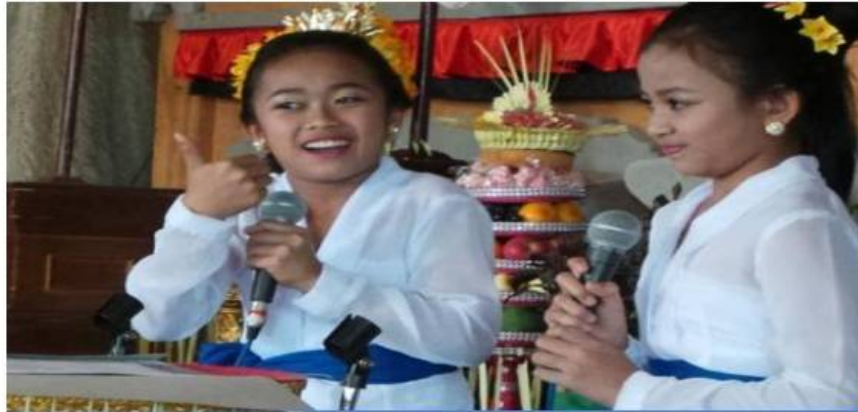
Tradisi Mekakawin (Dok. Istimewa)

Dalam pembacaan kakawin yang menggunakan huruf atau aksara Bali, maka suatu suku kata dinyatakan guru apabila sebuah huruf menggunakan sandangan tedong , berhulu sari , masuk ilut , mataleng , mabisah , masurang , macecek , dan segala yang matengenan . Selain itu, setiap huruf yang menghadapi guwung , menghadapi nanya , dan menghadapi suku kembang .