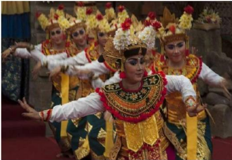
Dramatari Gambuh

Pada era keemasan raja-raja Bali, khususnya pada masa Dalem Waturenggong (1416-1550), tari Gambuh adalah seni pertunjukan prestisius kesayangan seisi istana. Namun ketika kolonialisme kemudian menggedor Bali yang menggerogoti kekuasaan kaum bangsawan, Gambuh limbung. Sekarang, seni pertunjukan yang diduga berasal dari Majapahit dan jejak-jejaknya sudah muncul di Bali saat pemerintahan Udayana pada abad ke-11 ini, mulai dibangkitkan lagi.