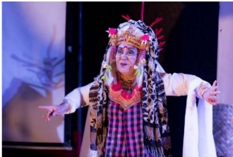
Gb. Sosok Matah Gede yang merepresentasikan Karakter Calon Arang

penduduk banyak yang sakit mendadak, wabah terjadi dimana-mana, sehingga dilakukan ronda oleh rakyat (bondres). Kesal akan situasi kerajaan yang kacau akhirnya Raja memerintahkan Patih Taskara Maguna untuk mengamankan situasi. Dengan sigap Sang Patih menyebar pasukan pengintai ( seserep telik sandi ) menantang kesaktian Walunateng Dirah. Singkat cerita keduanya saling adu kesaktian, Walunateng berubah wujud jadi Rangda (simbol ilmu hitam) dan Taskara Maguna berubah wujud jadi Barong (simbol kebajikan) akhirnya Walunateng Dirah dapat dikalahkan.