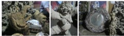
Gambar 19. Sejumlah karya ciptaan I Kadek Sudanco yang berbahan akar bambu.