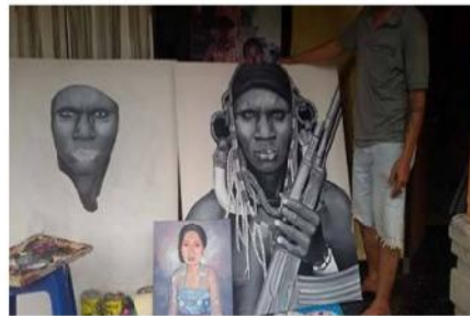
Gambar 18. Salah satu karya I Nengah Pujana.