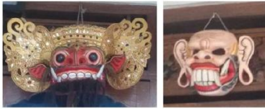
Gambar 4. Produk topeng karya I Nengah Sayang.