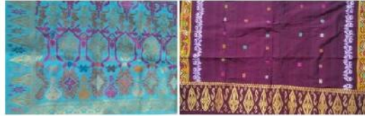
Gambar 17. Contoh tenun cagcag warga Desa Sidemen (Dok: Putu Nuri, 2018).