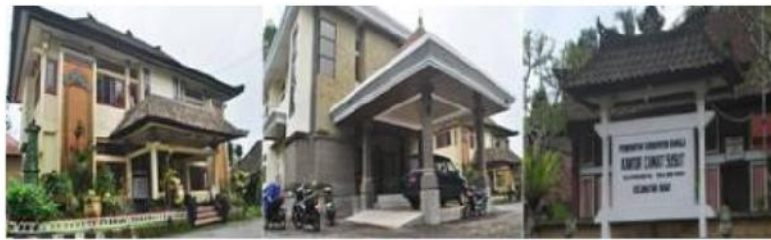
Gambar 3. Tampilan Kantor Camat Susut di Kabupaten Bangli