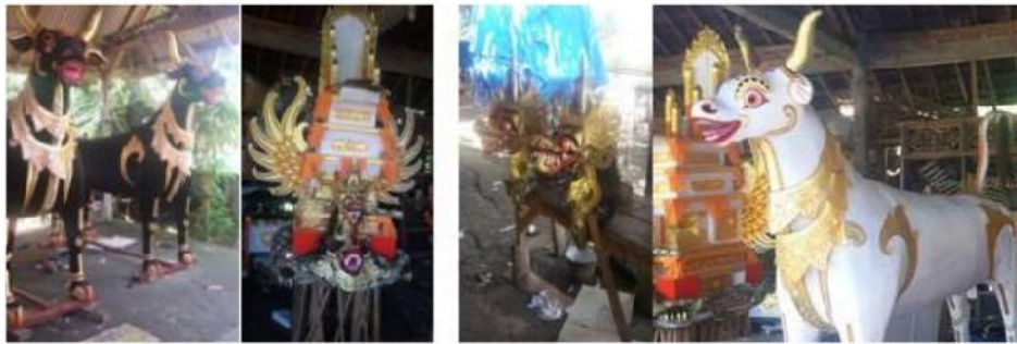
Gambar 8. Produk bade karya I Ketut Tantri (kiri) dan Jro Mangku Yadnya (kanan)

upacara tiga bulanan dan sekarang bahkan dipakai sebagai aksesoris di dalam suatu ruangan. Bahan bakunya berupa anyaman bambu, tetapi dikombinasi juga dengan bahan lainnya yang sejenis seperti rotan. Beberapa warga yang berdomisili di Kecamatan Susut Kabupaten Bangli mengerjakan jenis produk ini adalah I Nyoman Terima di Banjar Temaga Desa Tiga (Gambar 13).