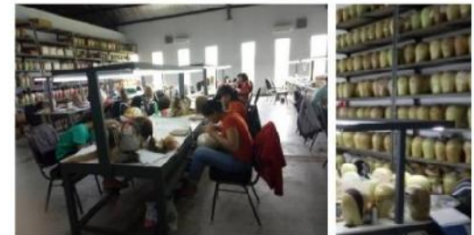
Gambar 20. Workshop dan produk wig yang dihasilkan.