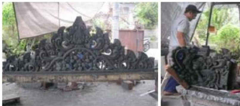
Gambar 24. Ukiran pasir meleda karya I Ketut Sila.