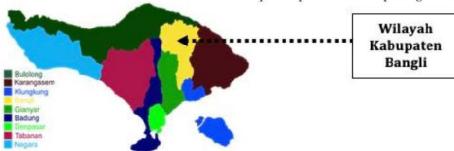
Gambar 1. Posisi Kabupaten Bangli pada Peta Pulau Bali.

Kabupaten Bangli yang merupakan bagian dari wilayah Provinsi Bali (Gambar 1), memiliki empat kecamatan yang salah satunya adalah Kecamatan Susut (Gambar 2). Memiliki luas wilayah 49,31 km 2 , berada di ketinggian 650 meter dari permukaan laut. Luas wilayah tersebut, telah dimanfaatkan untuk kepentingan pertanian seluas 1240, 50 hektar (25,16 %) dan tegalan 1449, 72 hektar (59,42 %) serta pekarangan 301,83 hektar (6,12 %) termasuk kegiatan lainnya seluas 436,62 hektar (9,30 %). Kecamatan Susut Kabupaten Bangli Provinsi Bali menaungi sembilan Desa, 50 Desa Adat (Desa Pekraman) dan 54 Banjar Dinas (Dusun). Jumlah penduduknya 44.680 jiwa, yang terdiri atas laki-laki 22.104 orang dan perempuan 22.576 orang serta sebanyak 4.852 jiwa memiliki kegiatan bertani. Mayoritas penduduk di Kecamatan Susut sedang berada dalam batas usia yang produktif, yaitu 15 – 45 tahun. Sebagai salah satu sumber daya dalam konteks pembangunan, maka penduduk Kecamatan Susut (Gambar 3) telah mengikuti kegiatan pembinaan dan pembangunan di bidang kependudukan agar dapat tercipta kondisi masyarakat yang mandiri dan sejahtera (Kecamatan Susut, 2019 dan BPS Kabupaten Bangli, 2019).