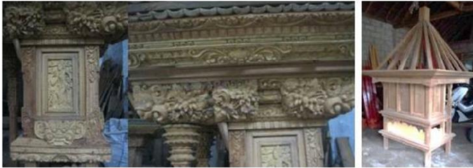
Gambar 7. Produk sanggah karya Gusti Pekak Polos (kiri) dan I Gusti Ketut Konje (kanan)