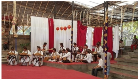
Gambar 1. Setting Panggung Mandolin Bungsil Gading (Dokumentasi : Foto Sudirga, 2016)

Sajian seni pertunjukan musik dipandang berhasil apabila didukung oleh kondisi suara instrumen, kemampuan teknik penabuh (musisi), dan reportoar yang dihasilkan oleh kreator (komposer). Ketiga hal tersebut saling mendukung untuk menghasilkan kualitas sajian yang mengandung bobot estetis yang mampu membuat penonton terpesona, larut dalam buaian estetis yang ngelangenin . Terkait dengan hal ini tentu berbagai hal yang berhubungan dengan nilai estetis dan desain artistik telah dipertimbangkan agar mampu menghasilkan emosi estetis, greget, daya pesona (taksu), baik secara instrumental maupun spiritual. Konsep tampil, terampil, dan penampilan menjadi pertimbangan logis seorang artistic director untuk mengkemas sebuah tampilan seni pertunjukan yang mampu membangkitkan emosi estetis penonton. Oleh karena itu susunan reportoar dalam tata penyajiannya juga menjadi pertimbangan tersendiri agar mengandung struktur dramatik yang tidak menjemukan ( monotone ). Dalam kaitan ini hal-hal yang bersifat non instrinsik seperti sound system, tata lampu, desain kostum yang mendukung tema sajian menjadi pertimbangan yang tak dapat diabaikan. Berkaitan dengan rias busana, Sanggar Mandolin "Bungsil Gading" menggunakan kostum udeng batik kombinasi endek dan ornamen prada pada bagian ujungnya, serta disumpangi kembang kamboja warna putih, berbaju putih, dengan selempang dari kain rembang di leher, saput endek, dan kain kamen putih bertepi kuning emas.