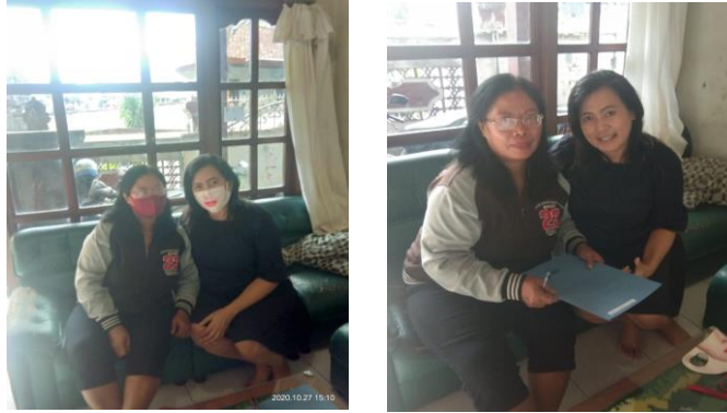
Foto 4,5. Bertemu dengan ibu ketua PKK Banjar Hita Bhuna untuk memberikan penjelasan kerja sama dan penandatanganan surat pernyataan kesediaan berkerjasama