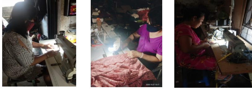
Foto 1,2,3. Keahlian ibu-ibu PKK Banjar Hita Bhuanan dalam menjahit baju menggunakan mesin jahit

Tujuan dari ketua dan ibu-ibu PKK Banjar Hita Bhuana ingin mengembangkan keahlian menjahit baju yang mereka miliki ke keahlian jahit bordir agar mereka dapat menggunakan hasil bordiran untuk memenuhi kebutuhan busana adat yang mereka sering gunakan. Disamping untuk potensi ini nantinya diharapkan dapat dikembangkan dan dapat meningkatkan pendapatan keluarga serta mereka dapat berperan aktif dalam melestarikan budaya Indonesia. Oleh karena itu dengan program kemitraan masyarakat (PKM) ini kami berharap dapat membantu mitra untuk memfasilitas mereka dalam berlatih membuat kerajinan bordir.