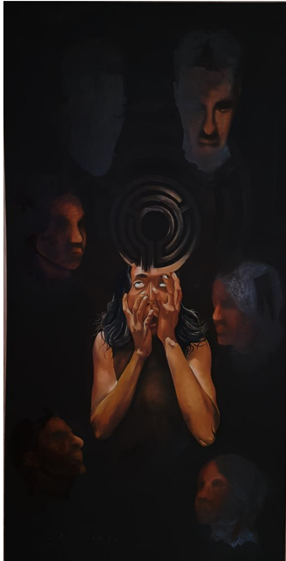
Gambar 2. Tersugestu , 2021, Cat minyak pada kanvas, 200 x 100 cm yang merupakan salah satu alternatif karya yang akan dikembangkan dalam penciptaan.