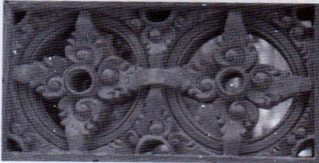
Gambar 1. Motif keketusan yang mendapat pengaruh ornamen asing.

lainnya. Penjelajahan mereka biasanya tidak jauh dari apa yang mereka kerjakan yaitu ornamen asing yang telah berkembang dan tersebar luas di masyarakat.