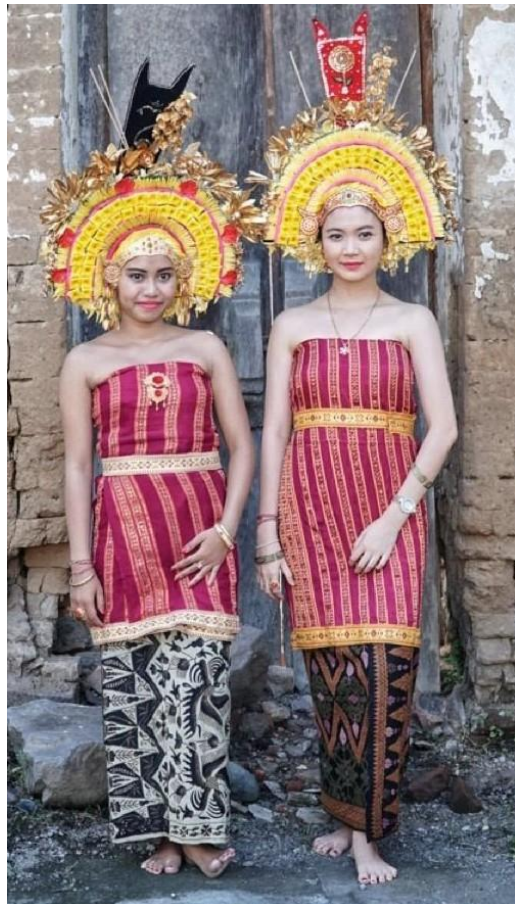
Figur 1. Penari Rejang Asak