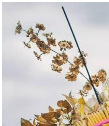
Figur 3. Bunga Anjel

Bunga anjel, terbuat dari bahan logam emas murni, menyerupai bunga anggrek sebagai stilirannya. Bunga anjel ini juga ditempatkan di bagian kepala, tapi diposisikan samping kanan bentuk bunga menjulang keatas, juga melambangkan kesan keagungan dan kemuliaan, warna dari emas kekuningan memberikan kesan kemeriahan dan lebih memberikan kegaierahan bagi penarinya. Bentuk bunga dari bawah keatas akan berbeda dari bentuk yang besar ke bentuk mengecil keatas, akan memberikan bentuk proporsional pada seluruh bentuk bunga anjel maupun penempatan di kepala penari rejang asak.