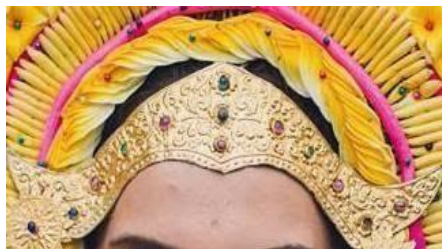
Figur 5. Blengker Emas

Blengker merupakan hiasan yang mengikuti bentuk wajah penari rejang asak, blengker juga memberikan bentuk wajah lebih cantik dan proposional. Blengker emas dibentuk melingkar diatas kening penari, atau disebut juga petitis (kening digambar berbentuk lingkaran sesuai bentuk wajah. Warna emas menunjukkan kemewahan pada mahkota penari. Dan ditatahkan dengan berbagai ornamen Bali seperti patra punggol, untuk memberikan kemegahan dan keagungan dari bentuk blengkat tersebut sewaktu dipakai oleh penari rejang asak. Ornamen yang digunakan adalah patra punggol.