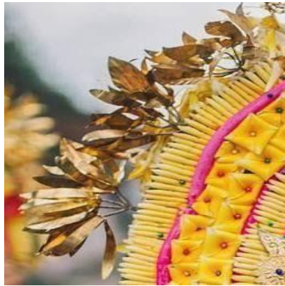
Figur 4. Bunga Sandat Emas

Bunga sandat emas, merupakan stiliran dari bunga sandat (kenanga), sandat, seorang seniman akan diinspirasi oleh bentuk dari bilahan bunga kenanga tersebut dan begitu bunga telah tua akan berwarna kuning tempat lebih hidup diterapkan pada mahkota rejang asak. Bau merupakan lambang keheningan dan bersemangat dalam beraktivitas/melakukan tarian rejang asak. Ditinjau dari bentuk bunga kenanga sangat harmonis dalam penerapannya. Dari warna keemasan melambangkan keagungan dan kemeriahan dalam kegiatan menari rejang asak.