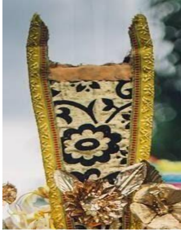
Figur 2. Bunga Tegeh