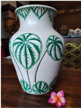
“Vas Keladi Semangka” Tanah Liat Putih 40 x 20 cm