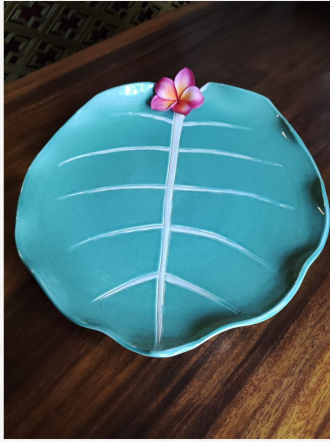
“Talam Keladi Neon” Tanah Liat Putih 40 x 25 cm