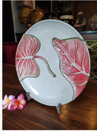
“Piring Dekorasi Dream Fantasy” Tanah Liat Putih 30 x 25 cm