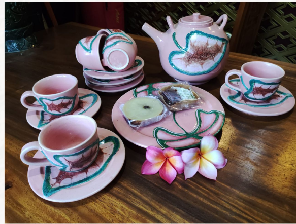
“Tea Set Keladi Motif Joker” Tanah Liat Putih 11 x 10 cm