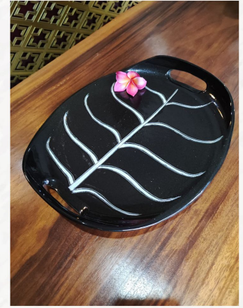
“Talam Black Velvet” Tanah Liat Putih 40 x 25 cm