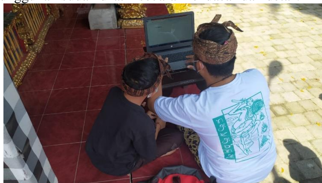
Foto. Pelatihan Gending Sekatian Dengan Metode Meguru Dingdong

Kemudian dari segi metode penulis menggunakan metode Meguru Tungguh dan Meguru Dingdong. Meguru Tungguh adalah metode pelatihan berdasarkan tungguhan atau kelompok instrumen gamelan seperti tungguhan gangsa, tungguhan reyong, tungguhan bantang gending, tungguhan terompong dan tungguhan kendang. Melalui metode Meguru Tungguh gending Sekatian diajarkan melalui grup-grup tungguhan tersebut seperti melodi dasar dilatih pada tungguhan bantang gending yaitu tungguhan penyacah, jublag dan jegog serta tungguhan terompong. Ornamentasi atau pepayasan gending Sekatian dilatih pada tungguhan gangsa dan reyong. Perubahan dinamika dan struktur gending dilatih pada tungguhan kendang. Kemudian setelah semua elemen gending diajarkan, maka dilakukan latihan gabung untuk menyatukan persepsi dalam menyajikan gending. Melalui metode Meguru Tungguh pertemuan besar yang melibatkan 18 orang penabuh tersebut dapat dikurangi tanpa mengurangi esensi pelatihan gending Sekatian. Mengingat dalam latihan per grup tungguhan sudah dilatih secara mendasar dan detail.