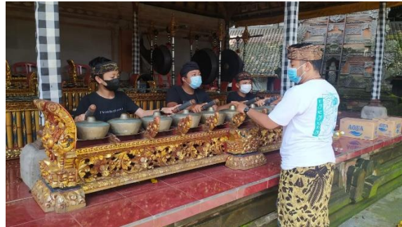
Foto Pelatihan Gending Sekatian Dengan Metode Meguru Tungguh

Kebyar diantaranya satu tungguh kendang cedugan/ceditan, satu pangkon kecek, satu tungguh terompong, satu tungguh reyong, satu tungguh kajar, sepasang tungguh penyacah, sepasang tungguhan calung/jublag, sepasang tungguhan jegog dan satu tungguh gong dan kempur. Dengan jumlah tungguhan tersebut dimainkan oleh 18 orang penabuh. Maka dengan 18 orang penabuh dapat meminimalisir kuantitas penabuh dari yang format konvensional berjumlah 35-40 orang penabuh.