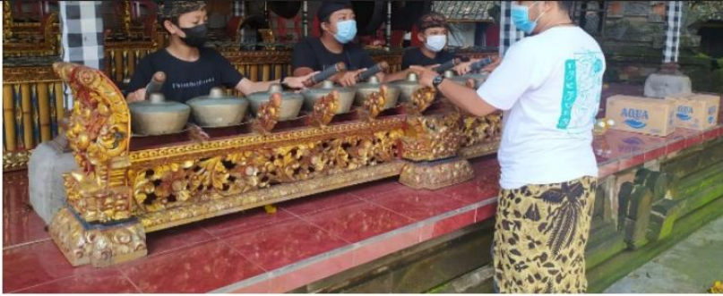
Pelatihan Gending Sekatian Dengan Metode Meguru Tungguh