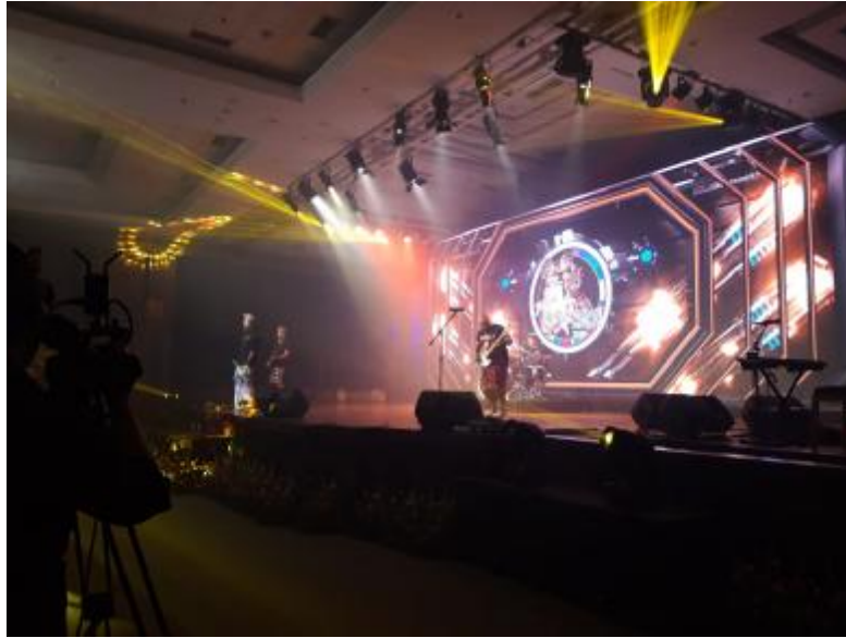
Gambar 1. 7 Acara pada tanggal 10 Desember Berlangsung dengan meriah