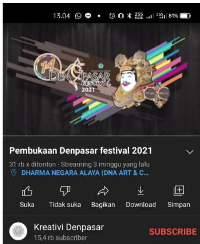
Gambar 1. 9 Jumlah penonton

sosial. penulis juga mengamati, masyarakat kota Denpasar sangat antusias untuk menonton acara pembukaan Denpasar Festival ke-14 melalui akun Youtube “Kreativi Denpasar”. penonton live streaming acara ini berjumlah 30 ribu penonton. Dan terus bertambah. Mayoritas komentar penonton video Youtube acara Pembukaan Denpasar Festival sangat positif. Ini bisa dilihat di bagian dibagian komentar video Youtube acara Pembukaan Denpasar Festival ke-14.