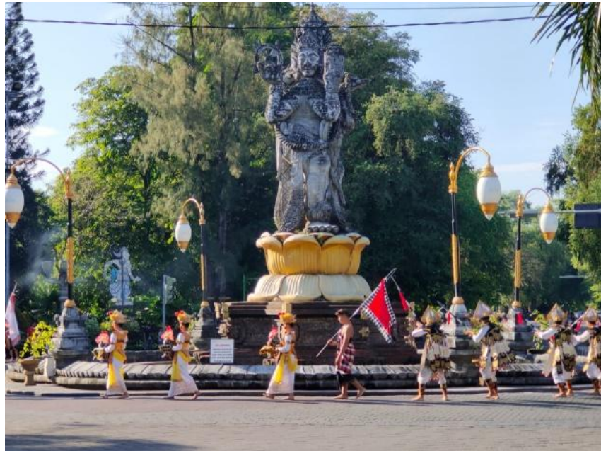
Gambar 1. 5 Sesi perekaman playback video di Catur Muka