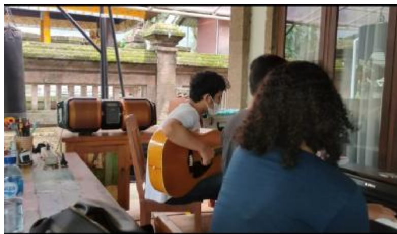
Gambar 1. 2 Proses mencari melodi yang akan dinyanyikan dan menentukan nada dasar