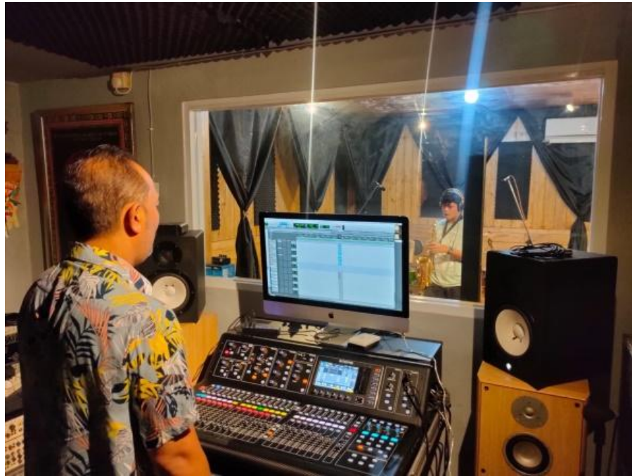
Gambar 1. 3 Sesi perekam saxophone