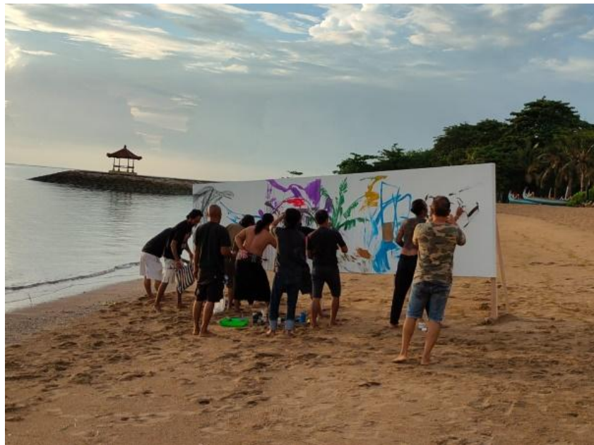
Gambar 1. 4 Sesi perekaman playback video di Pantai Sanur