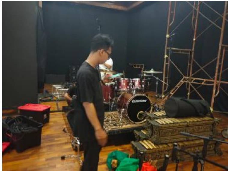
Gambar 1. 8 Setelah acara selesai. Penulis (stage crew) ikut membantu menurunkan alat musik ke bawah panggung