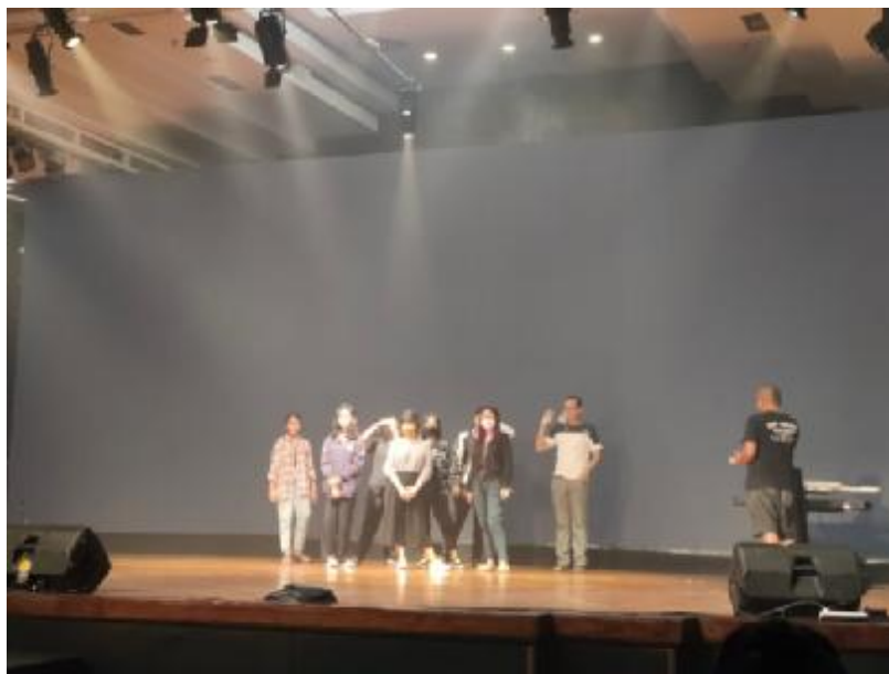
Gambar 1. 6 Gladi bersih pada tanggal 9 Desember di Gedung Alaya Dharma Negara Denpasar