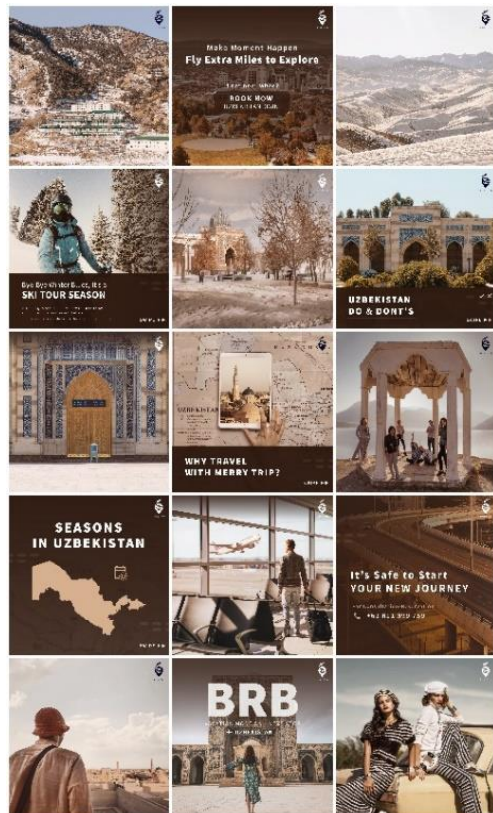
Gambar 3. Inftagram Feed ( Monthly Feed )

Latar dari proyek desain untuk social media management Instagram Merry Triip adalah bahwa Merry Triip merupakan usaha travel agent dengan tujuan perjalanan ke luar negeri. Merry Triip memiliki rencana untuk memiliki tujuan perjalanan ke berbagai negara berbeda. Ketika penulis terlibat dalam proyek ini, Merry Triip sedang dalam periode perjalanan ke Uzbekistan. Jenis media yang digunakan adalah format unggahan Instagram jenis Instagram Post/Feed. Adapun konsep karya yang dirumuskan penulis diantaranya adalah: