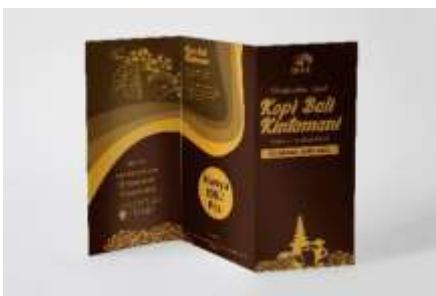
Gambar 3 Mockup Desain Media Brosur.

Desain media ini berfungsi untuk promosi langsung di dalam toko. Pelanggan bisa membawa pulang brosur yang disediakan untuk diberikan ke kawan, keluarga, dan kenalan mereka. Sehingga, dapat mendatangkan konsumen baru.