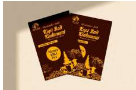
Gambar 4 Mockup Desain Media Flyer .

Desain media ini berfungsi untuk promosi di luar toko. Kopi Nini bisa menaruh flyer di beberapa tempat wisata seperti mall, daya tarik wisata, atau papan informasi pariwisata.