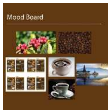
Gambar 1 Moodboard Desain Media Promosi Kopi Nini

Tujuan dari pembuatan media promosi Kopi Nini adalah untuk menginformasikan kepada masyarakat mengenai promosi potongan harga yang ada di Kopi Nini. Dalam proyek tersebut, penulis membuat konsep ( moodboard ) untuk perancangan media promosi tersebut.