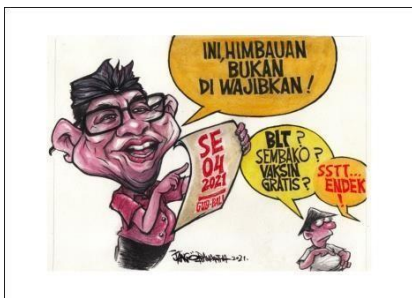
Gambar 2. karya dari Bog-Bog

dari Bog-Bog sebagai keperluan penelitian. Berikut merupakan hasil dokumentasi berupa event-event yang pernah di laksanakan oleh perusahaan