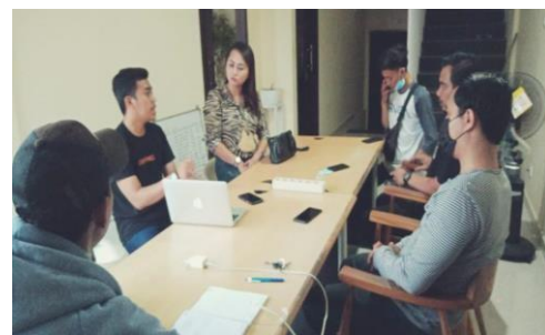
Gambar 1. wawancara

Wawancara merupakan proses pengumpulan data, menggunakan informan yang menjawab pertanyaan yang diajukan untuk kepentingan penelitian. Dalam riset kuantitatif tipe wawancara yang digunakan dalam bentuk yang terstruktur. Saat melakukan proses wawancara penulis memberikan beberapa pertanyaan, salah satunya (1) bagaimana sejarah berdirinya PT. Duta Niaga Dewata? (2) bagaimana struktur organisasi yang ada di PT Duta Niaga Dewata (3) bagaimana filosofi dari perusahaan PT. Duta Niaga Dewata?. Berikut merupakan foto saat melakukan wawancara yang dapat penulis dokumentasikan.