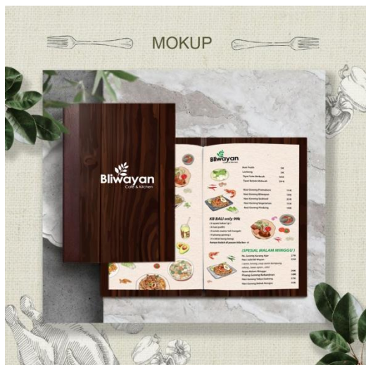
Gambar 6 Mokup

Terdapat penerapan konsep desain berdasarkan unsur visual diantaranya sebagai berikut: