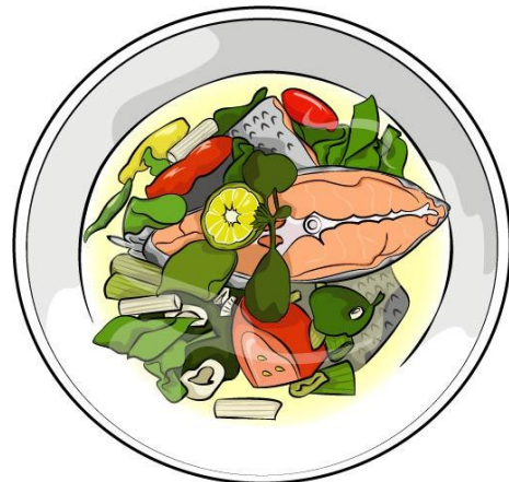
Gambar 3 Thumbnail desain ilustrasi digital