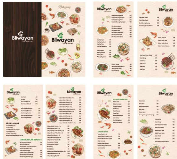
Gambar 4 Tight tissue ilustrasi buku