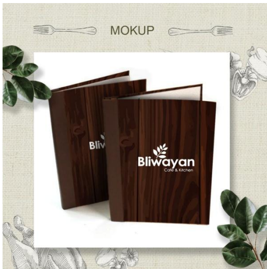
Gambar 5 Mokup