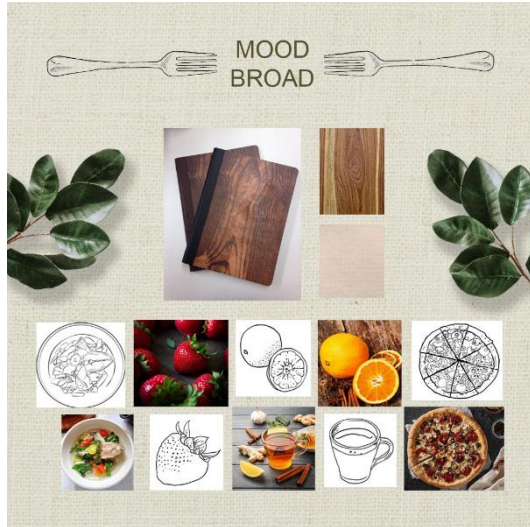
Gambar 1 Moodboard Desain Media buku daftar menu

berarti rancangan isi, style, format, layout, urutan dari macam-macam buku. Komponen berarti bagian atau halaman dari buku, seperti catatan edisi, pengantar, indeks, atau cover depan dan belakang.