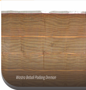
Wastra Bebali Padang Dreman