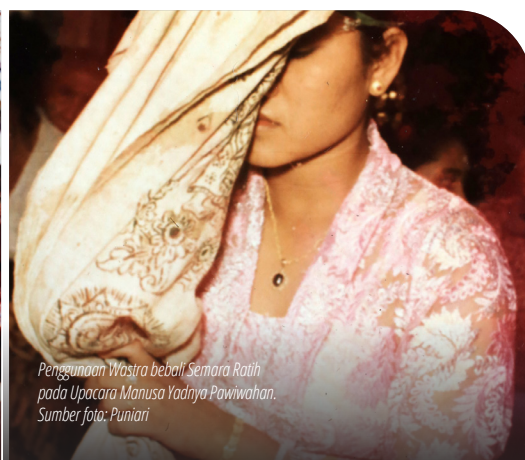
Penggunaan Wastra bebalı Semara Ratih pada Upacara Manusa Yadnya Pawiwahan.