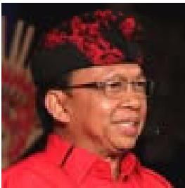
WAYAN KOSTER Gubernur Bali