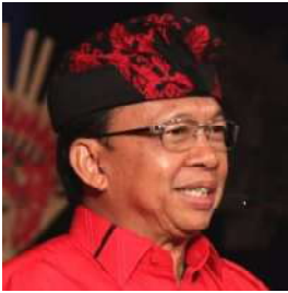
WAYAN KOSTER Gubernur Bali