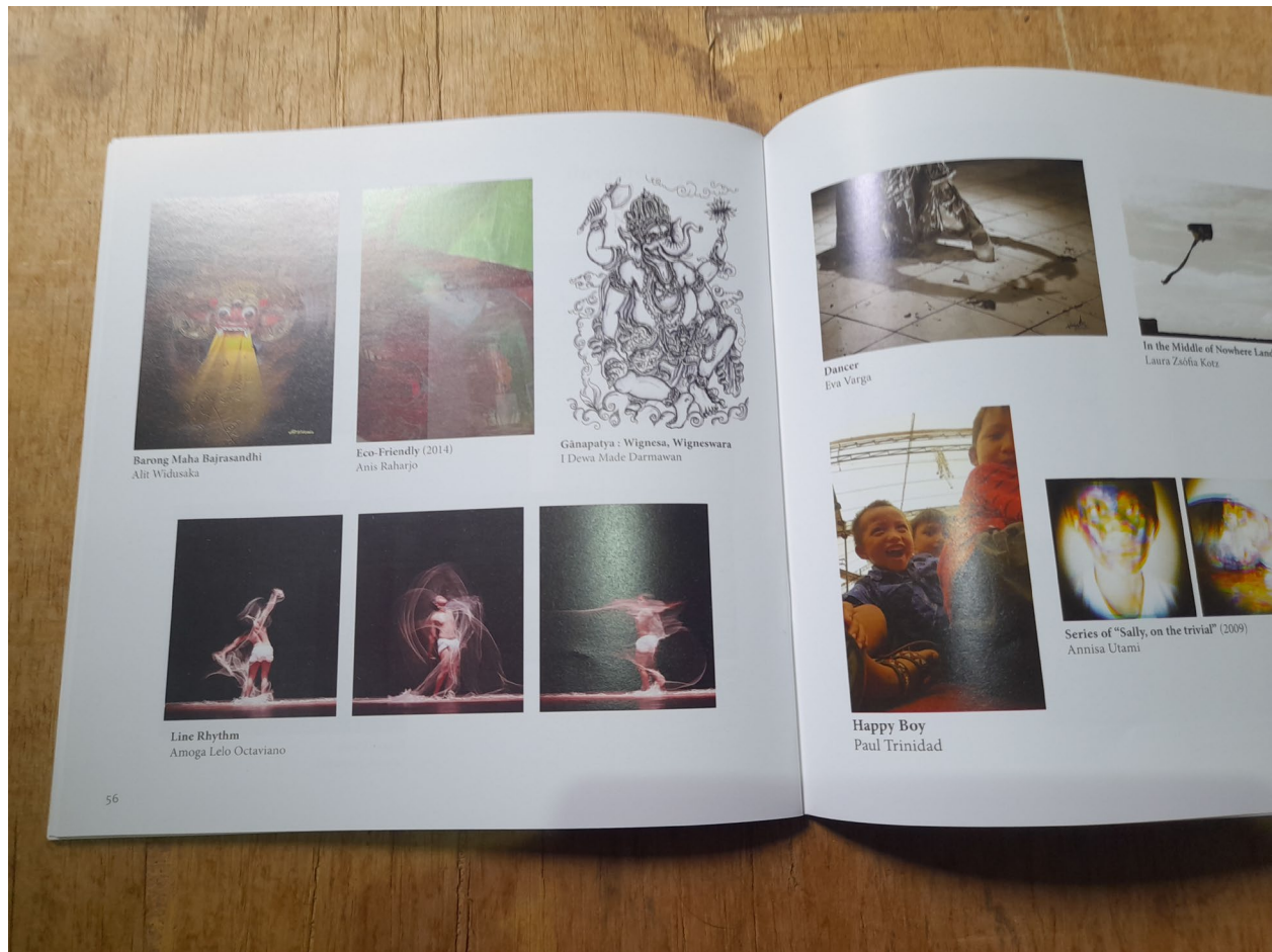
Foto 3. Halaman ke-56 katalog pameran yang memuat karya pencipta