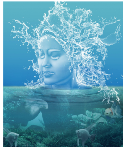
BAYU SEGARA PUTRA Queen of Life, 2022, 70 x 50 cm, print on luster

Hepifacial spasm yang makin berat pada akhirnya memunculkan sikap pasrah, nirno. Mahkota duri yang menembus kepala Yesus adalah satu dari banyak jenis penyiksaan dan hinaan. Bersama kayu salib, mahkota duri sebagai simbol penderitaan yang monumental. "Setiap orang yang mau mengikut Aku, ia harus menyangkal dirinya, memikul salibnya dan mengikut Aku." (Matius 16:24). Menyangkal diri sendiri berarti menanggalkan ambisi, ego, pasrah, berserah kepada kehendak-Nya. Sanggup menjalani hidup dengan memikul penderitaan. Hidup bersama segala rasa sakit.