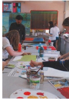
Foto proses workshop penyiapan karya seni untuk pameran dengan tema air.