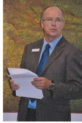
Foto-foto atas suasana pembukaan pameran dan bawah penyerahan kenangan oleh Direktur Balai Bahasa Indonesia Perth Inc ( kiri) dan (kanan) piagam apresiasi dari Como Secondary College Perth, Western Australia.