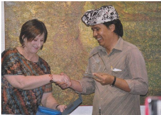
Foto atas penyerahan kenangan oleh Direktur BBIP kepada penulis.