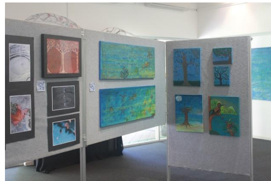
Foto karya seni intalasi dan instalasi karya seni dalam pameran yang berjudul "Air".