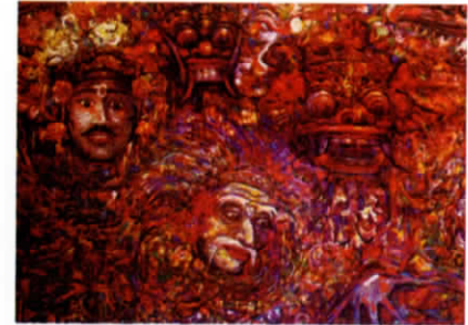
I Ketut Marra Lukisan Topeng Cat Minyak Di Kanvas 2015