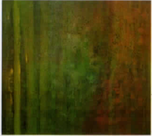
I Made Jodog Landuh Acrylic Di Kanvas 150 x 150 cm 2015