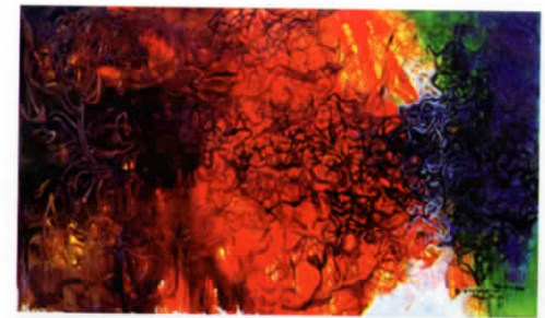
I Wayan Santrayana Maya Rupa Acrylic Di Kanvas 100 x 200 cm 2015