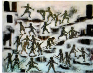
Pande Putu Gde Sarjana Tinggal Pilih Drawing Di Kanvas 135 x 110 cm 2014