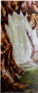
I Ketut Marra Putih Yang Belah Acrylic Di Kanvas 100 x 60 cm 2015