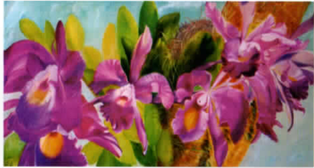
AAA Saraswati AP Untaian Chatteleya Ungu Cat Minyak Di Kanvas 65 x 140 cm 2014