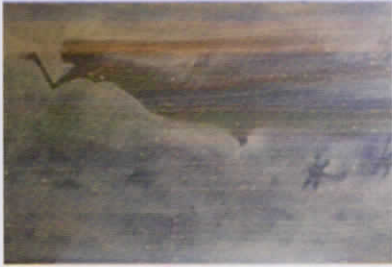
Made Jodog "Mother Nature" 2014 Repleksi energi semesta, renungan kepada ibu