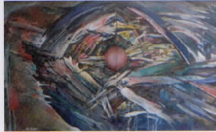
AA Gede Yugus "Energi Semesta" 2014 Abstraksi ruang kosmos