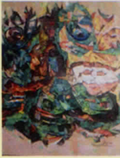
I Nengah Wira Kesuma. "Meta Topeng" 2015 Representasi baru makna topeng