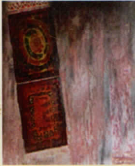
I Gede Yosep Tj. "Black Artefact" 2016 Artefact budaya, kesaksian pada sejarah