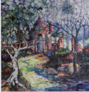
Wayan Gunawan "Pemandangan Pura" 2015 Harmoni pura dan alam, keindahan relius