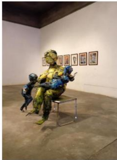
Foto 3.27. Karya I Made Jodog pada Intermingle Arts Project "Light Patterns"