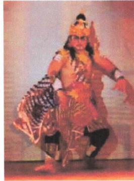
(Patih Gajah Mada)