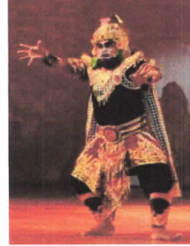
(Patih Kebo Iwo)