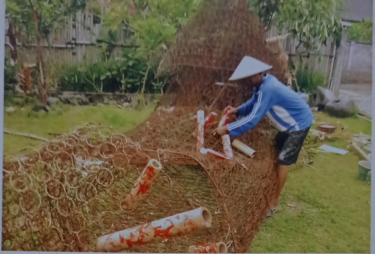
foto - foto proses