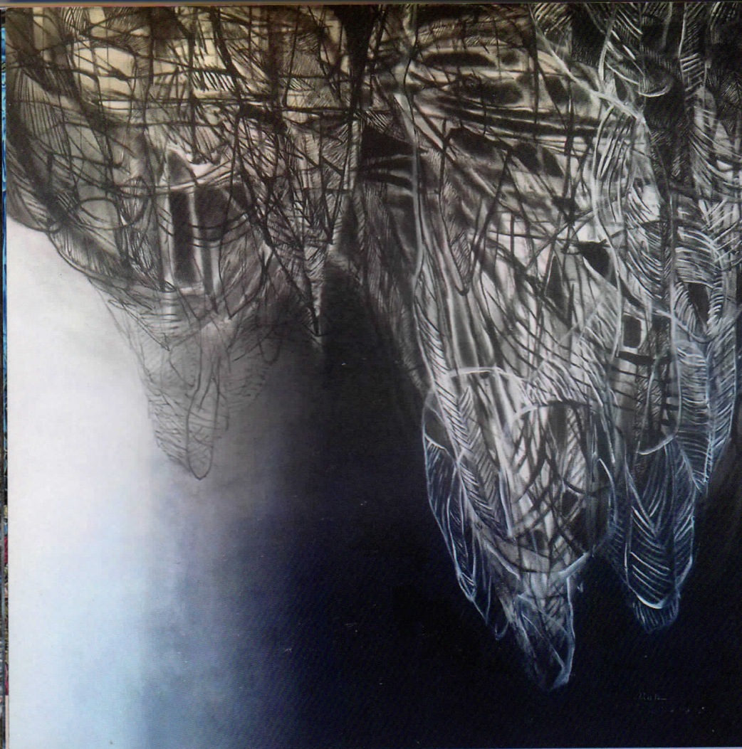
“Pencarian” Acrylic Di Atas Kanvas, 145 x 145 cm, 2015