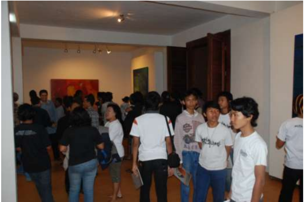
Suasana pameran di lantai bawah yang dipadati pengunjung