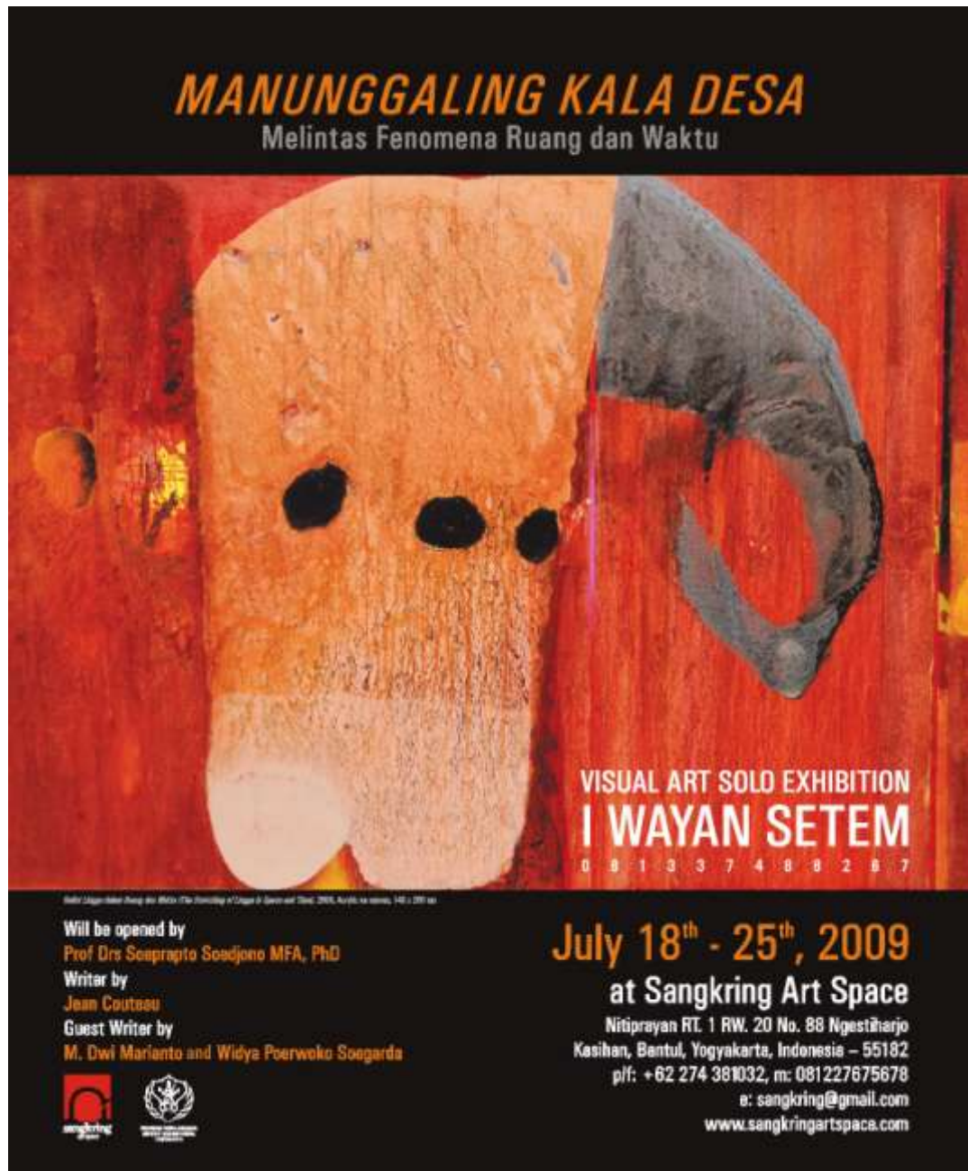
Publikasi pameran pada majalah Arti , Edisi 017 Juli 2009, h. 109.