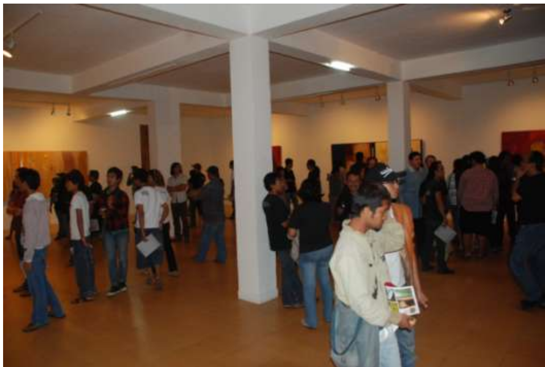
Pengunjung menyaksikan karya