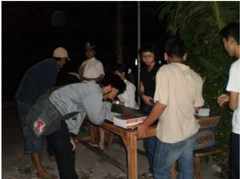
Pengunjung mengisi daftar hadir dan pembagian katalog pameran