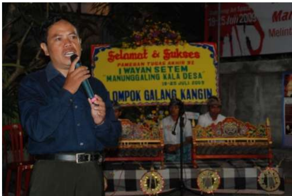
Pengkarya memberi sambutan