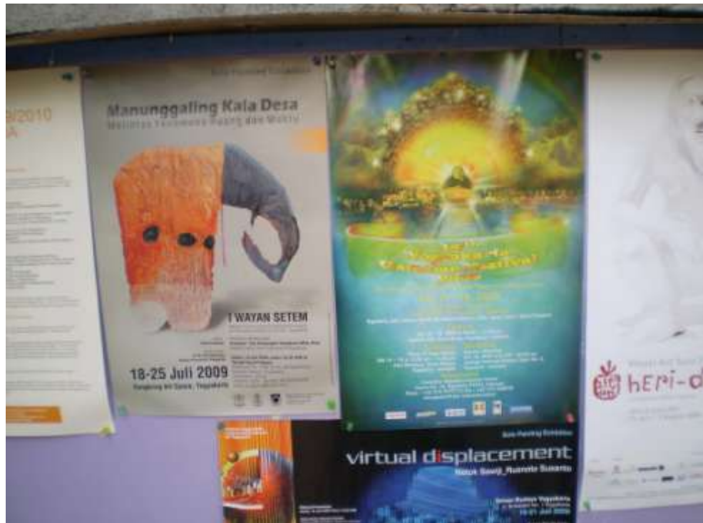
Poster ditempelkan pada tempat yang strategis.