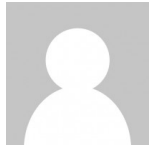
Gde Palgunadi AUTHOR